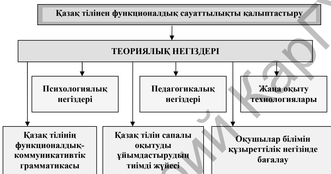
2-сызба. Қазақ тілінен функционалдық сауаттылықты қалыптастырудың теориялық негіздері

Қазақ тілін оқыту барысында оқушылардың функционалдық сауаттылығын қалыптастырудың теориялық негіздері жүйесінің моделі төменде көрсетілді (2-сызба).