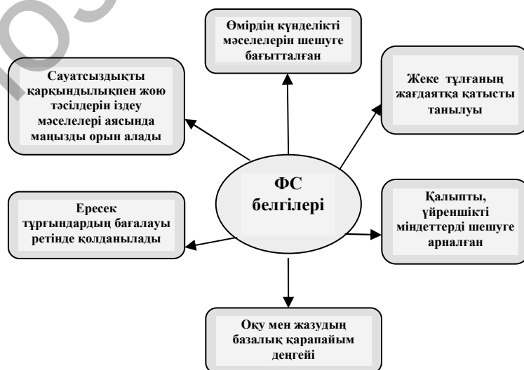
1-сызба. Қазақ тілінен функционалдық сауаттылықтың (ФС) белгілері

Қазақ тілін оқыту барысында қалыптастырылуы тиіс деп күтілетін «функционалдық сауаттылықтың» белгілерін төмендегі модельден көруге болады (1-сызба).