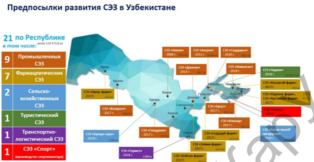
Рисунок 3. Предпосылки развития специальных экономических и индустриальных зон Республики Узбекистан

тельным условием является создание большого количества рабочих мест и в то же время развитие высокотехнологичных отраслей друг с другом (рис. 3).