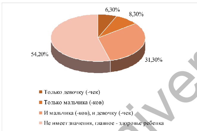
Рисунок 2. Распределение ответов девушек на вопрос о предпочтительном поле будущего ребенка.

31,3% предпочли «и мальчика (-ов), и девочку (-чек)», 8,3% – «только мальчика (-ков)», и 6,3% – «только девочку (-чек)».