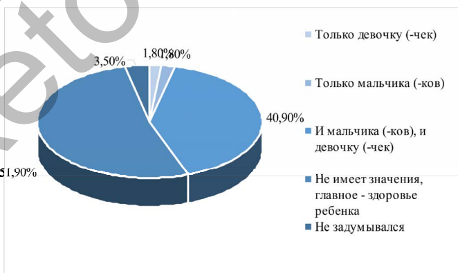
Рисунок 3. Распределение ответов парней на вопрос о предпочтительном поле будущего ребенка.

Среди парней 51,9% выбрали «неважно, главное – здоровье ребенка», 40,9% предпочли «и мальчика (-ков), и девочку (-чек)», 3,5% не задумывались на этот счет, а по 1,8% отметили варианты «только мальчика/мальчиков» и «только девочку/девочек». Таким образом, гипотеза о том, что мужчины чаще желают иметь именно мальчиков, не подтвердилась.