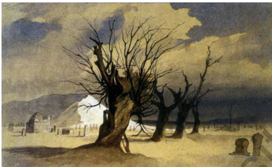
Сурет 2. Ханга-баба [10, с. 25]

Халық аңызы мен жазбаша деректерге қарағанда орта ғасырлар бойы мұнда оғыздар, қыпшақтар, ноғайлар, башқұрттар, түркімендер және қазақтардың тайпалық топтары және XVIII ғасырдың үшінші жартысында қалмақтар кезекпен көшіп-қонып жүрген (Мендикулов, 1956). Осы мәліметке сүйене отырып ғалым Бейнеу қорымының ең ежелгі құлпытастарын оғыз-қыпшақ және қыпшақ-ноғай тайпалары салуы мүмкін деген қорытындыға келеді. Қорымдардың кирап кетуіне байланысты олардың салыну уақыты мен этникасын анықтау мүмкін болмаған.