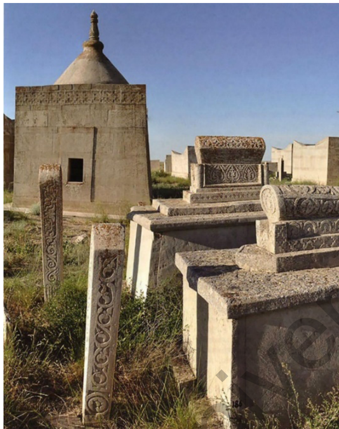
Сурет 7. Сисем ата [8; 236]

«Маңғыстау мен Үстірт ескерткіштері» кітап-альбомының жарық көруі С.Е. Әжіғалидың осы аймақты зерттеу бойынша ең үлкен жетістігі болды [20; 504]. Ол өзінің көп жылдық жұмысы барысында теориялық және практикалық зерттеулердің негізгі нәтижелерін ұсынды. Ғалым көптеген жылдар бойы мемориалдық және діни ескерткіштердің типологиясын зерттеумен айналысты. Оны көшпенділердің мемориалдық және діни ескерткіштерін зерттеудің негізі деп санауға болады. Зерттеуші олардың барлығын екі үлкен бөлікке: ғұрыптық және мемориалдық ескерткіштер деп бөлуді ұсынды. Ол алғашқы топқа мешіттер мен әр түрлі ғибадат орындарын жатқызса, екіншісіне (ең кең таралған) — мемориалдық ескерткіштерді (жерлеу орындары, қабірлер) жатқызды [20; 142, 148].