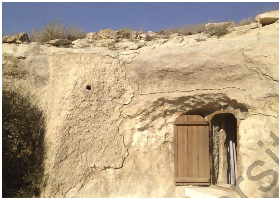
Сурет 1. Шопан ата жерасты мешіті [8; 228]

Ғалымның еңбегінде Шопан ата мешіт-мазары аймақтың діни орталығына айналу мақсатында салынғандығы айтылады. Оған дәлел ретінде бөлменің үш негізгі топқа бөлінген құрамын атап өтеді. Бөлменің орталық бөлігінде қонақ бөлмесі іспетті жасақталған төртбұрышты зал орналасқан. Орталық залдың оңтүстік-батысында көлбеу орналасқан баспалдақ жоғарғы қабаттағы құлшылық бөлмесі мен екі жерлеу орнынан тұратын қабірлер бөлмесіне апарады. Орталық залдың оңтүстік және батыс қабырғаларының бүкіл ені зиярат етушілерге арналған екі кең бөлмеге бөлінген. Ыдыс-аяқтар: самаурындар, шәйнектер, құмған және басқа да тұрмыстық ыдыстар солтүстік қабырға бойына орналастырылған. Ауа райының әсерінен мешіттің солтүстік қабырғасы қатты зақымданған. Бұл мешіт-мазардың нақты мерзімі туралы дәйекті ақпараттар жоқ, себебі белгілі жазба деректерде Шопан ата атауы кездеспейді [1; 8, 9].