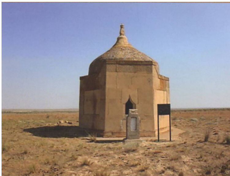
Сурет 5. Сүндет кесенесі [14; 115]