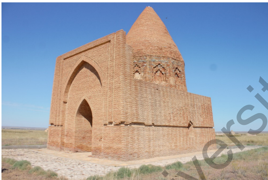
Сурет 6. Абат-Байтақ кесенесі

Шақпақ ата, Қараман ата, Балғасын); 2) кейінгі ортағасырлық XIV ғ. (Кенді баба, Үштам, Масат ата, маңғыстаулық Қошқарата, үстірттік Қошқар ата, Сисем ата, Абат-Байтақ, Қарасақал, т.б.); 3) жаңа уақытта қалыптасқан кешендер — XVIII-XIX ғғ. (Қарашық, Қызылсу, Сағындық, Бейсембай, Алып ана, Дәуімшар, Нұрманбет, Дәуіт ата, Қарабас әулие, Хан моласы және т.б.) [3; 34].