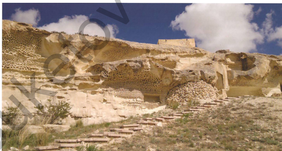
Сурет 3. Шақпақ ата жерасты мешіті [8; 233]

Батыс Үстірт аумағында Шақпақ ата жерасты мешіті сияқты халық аңыздарында қыпшақ-ноғайлы кезеңімен байланыстырылатын ежелгі ескерткіштер бар (сурет 3). Қорымның оңтүстік-батыс бөлігінде жерасты мешіті және Шақпақ ата мен оның қызының қабірі орналасқан. Олар тау массивіне ойылып, саңылаулармен байланысқан шағын камера болды [6; 11].