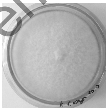
в — F. oxysporum контроль