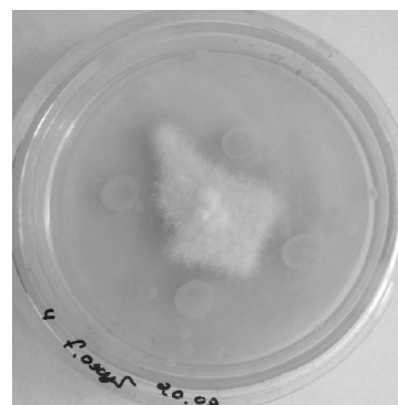
г — штамм AS29 против F. oxysporum