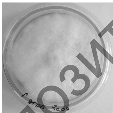
а — F. graminearum контроль

Примечание. «+» — малочувствительные, прозрачная зона от роста гриба (1 мм); «++» — чувствительные, прозрачная зона от роста гриба (1–3 мм); «+++» — высокочувствительные, прозрачная зона от роста гриба (>3 мм).