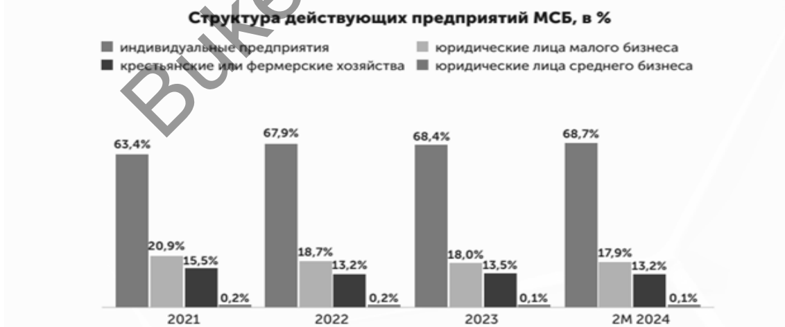
Рисунок 2. Структура действующих предприятий МСБ

Предприятия МСБ активно задействованы в различных секторах экономики, таких как торговля, финансы, наука и производство. В Казахстане торговля является наиболее распространенной сферой деятельности среди предприятий МСБ.