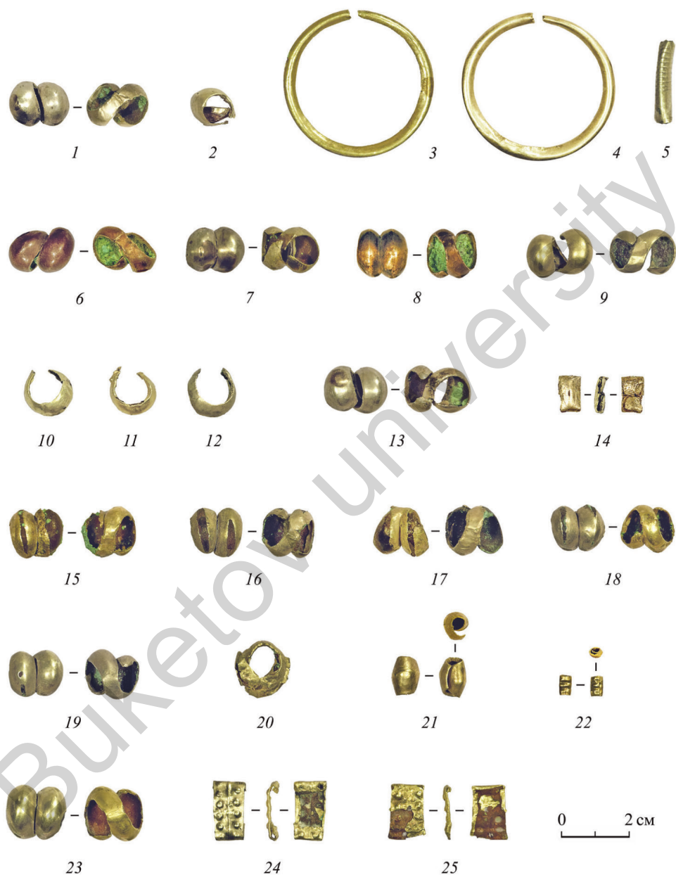
Рис. 1. Украшения с золотым декором из могильников Центрального Казахстана

1–8 – Саган (КДМ 1–5, 11, 12, 26); 9 – Нуркен (КДМ 18); 10–14 – Копа (КДМ 6–10); 15–22 – Бозинген (КДМ 13–17, 20, 23, 24); 23 – Ташик (КДМ 19); 24, 25 – Акимбек (КДМ 21, 22)