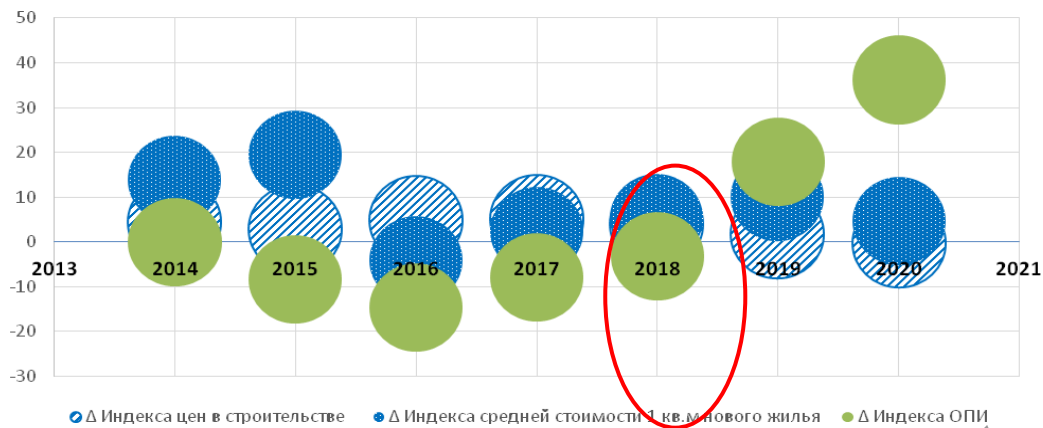
Рисунок 1. Разрыв индексов, характеризующих развитие жилищного строительства, %

Примечание. Составлено авторами на основе (Бюро национальной статистики Республики Казахстан, 2021; АФК, 2021).