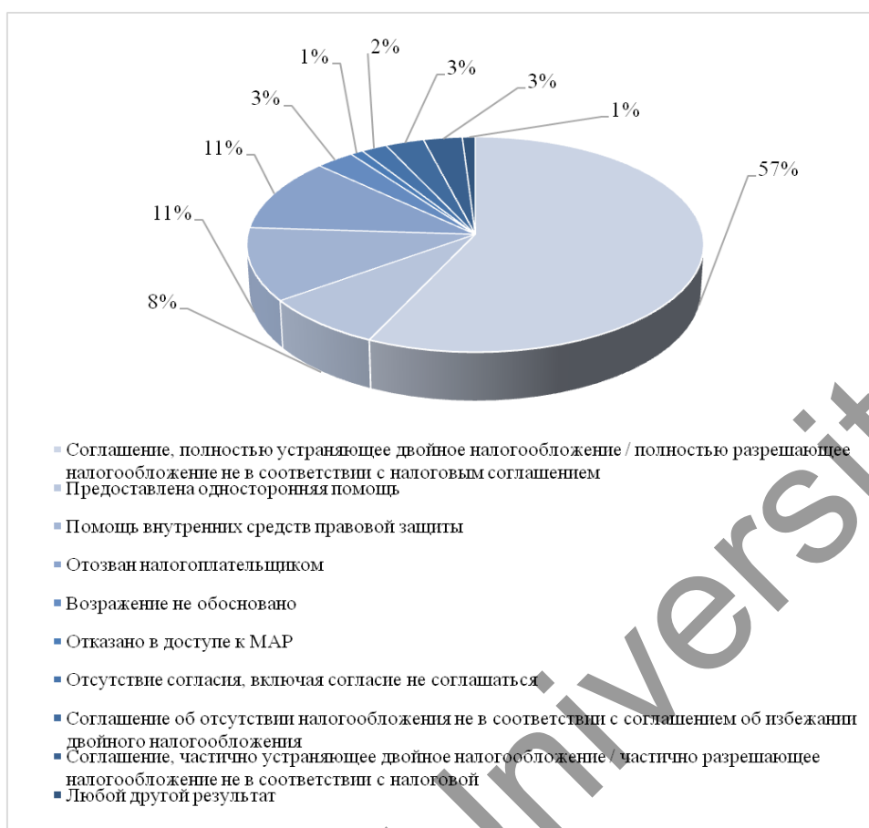
Рисунок 2. Результаты закрытия сделок MAP и APA по ТЦО (2021 г.)*

*Примечание. Составлен автором на основе Официального сайта ОЭСР.