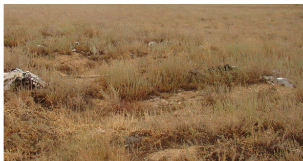
Рисунок 7. Белоземельнополынное сообщество

В полынных ( Artemisia terrae-albae , Artemisia semiarida ) сообществах с дерновинно-злаковыми группировками — типчак, ковыль, житняк ( Festuca valesiaca , Stipa sareptana , Agropyrom fragile ) —