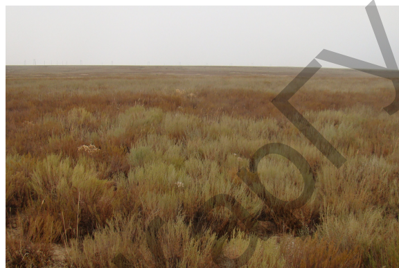
Рисунок 9. Чернополынное сообщество

На деградированных в значительной степени участках увеличивается доля рудеральных одно- и двулетников, таких как солянка облиственная и холмовая ( Salsola foliosa , S. collina ), клоповник пронзеннолистный ( Lepidium perfoliatum ), рогач песчаный ( Ceratocarpus arenarius ), латук татарский и дикий ( Lactuca tatarica , L. serriola ), додарция восточная ( Dodartia orientalis ), марь остистая ( Chenopodium aristida ) и др. Встречаются участки, на которых происходит почти полное выпадение в результате регулярных пожаров естественной растительности и замена ее на рудеральные сообщества.