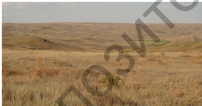
Рисунок 3. Разнотравно-полынное сообщество с участком ферулы шаир