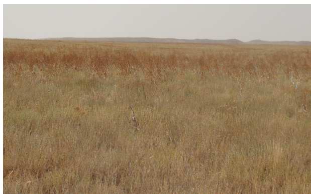
Рисунок 8. Феруло-полынное сообщество

На отдельных участках территории встречаются чистые чернополынные сообщества с участием полыни ( Artemisia pauciflora ), типчака ( Festuca valesiaca ), тысячелистника благородного ( Achillea nobilis ), рогача песчаного ( Ceratocarpus arenarius ). Общее проективное покрытие чернополынных — 10–20 %, видовой состав не превышает 10 видов (рис. 9).