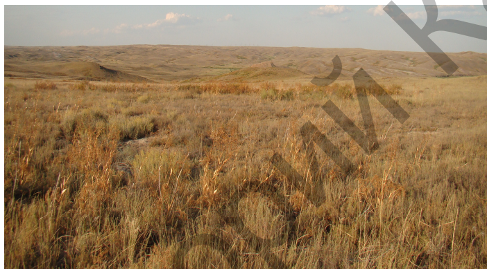
Рисунок 5. Полынно-разнотравно-боялычевое сообщество

На основной части обследованной территории преобладают комплексные разнотравно-злаково-полынные, разнотравно-полынные, полынные, полынно-разнотравные типы сообществ с участием полынных ( Artemisia terrae-albae , A. semiarida , A. pauciflora ), ферулы шаир ( Ferula schair ), эфедры двухколосковой ( Ephedra distachya ), типчака ( Festuca valesiaca ), житняка ( Agropyron desertorum ), пижмы пижмовидной ( Tanacetum tanacetoides ), ферулы татарской ( Ferula tatarica ), лебеды седой ( Atriplex cana ), мятлика луковочного ( Poa bulbosa ), житняка ломкого ( Agropyron fragile ), ковыля сарептского ( Stipa sareptana ) на бурых, бурых слабозасоленных, неполноразвитых бурых почвах (рис. 5).