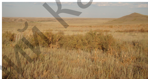
Рисунок 2. Полынно-разнотравно-феруловое сообщество