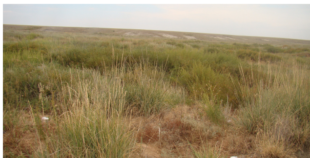
Рисунок 1. Кустарнико-злаковое сообщество

Растительность равнинных и мелкосопочных территорий. Значительная часть степных территорий представлена равнинными, низкоувалистыми, мелкосопочными участками. В северной части равнины прерываются буграми Коктобе, на юго-востоке — низкими горами Айдарлы. Центральная часть территории представляет собой увалистые и слабоволнистые равнины с участками щебнистых осыпей, выходами третичных глин, солончаками. Перепады высот составляют от 300 до 420 м.