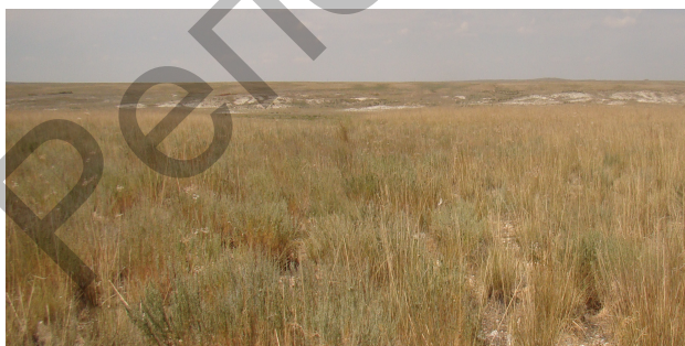
Рисунок 6. Полынно-ковыльное сообщество

Указанные выше сообщества характеризуются средним проективным покрытием территории от 10 (на сильно трансформированных) до 60 %. Флористический состав насчитывает 10–15 видов. Доминируют пустынные и степные элементы — ковыль ( Stipa sareptana ), житняк ( Agropyron fragile ), типчак ( Festuca valesiaca ). По логам и понижениям нередко можно встретить таволгу зверобоелистную ( Spiraea hypericifolia ), солянку деревцевидную ( Salsola arbuscula ), ячмень дикий ( Hultemia persica ), карагану Бонгардовскую ( Caragana bongardiana ) (рис. 6, 7).