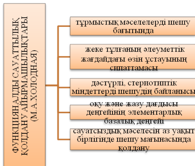
1-сурет. М.А. Холодная еңбегі бойынша функционалдық сауаттылық ұғымының негізгі белгілері

Тұлға өзінің кәсіби білімінің, іскерліктерінің, дағдыларының, тәжірибесінің және тұлғалық қасиеттерінің деңгейімен, оның өзіне қатысты үздіксіз білім алуымен, атқарған ісіне шығармашылықпен, жауапкершілікпен қарауымен ерекшеленеді. Осы аталған барлық қасиеттер білім берудің құрылымы мен мазмұнында ғана емес, сонымен қатар сауаттылық құрылымында да болуы тиіс. Біріншіден — тек қана кәсіби деңгейде өзекті болатын, сұранысқа толы функционалды сауаттылық, екіншіден — оның тек пәндік мазмұнға ғана тәуелді емес, сонымен қатар тұлғаның қасиеттерін қалыптастыратын компоненттері болып келеді. Функционалдық сауаттылыққа қол жеткізген оқушылар білім алуы барысында өмірдің қалыпты жағдайларында кездесетін түрлі жағдаяттардың шешімдерін таба алатын қабілетке ие болған. Негізінен, қолданбалы білімін жүзеге асыра алатын деңгейдегі білім иесі. Жинақтай алғанда, функционалдық сауаттылық оқушының жеке тұлғасының әлеуметтенуіне игі ықпал ететін басты тірек деп есептеледі.