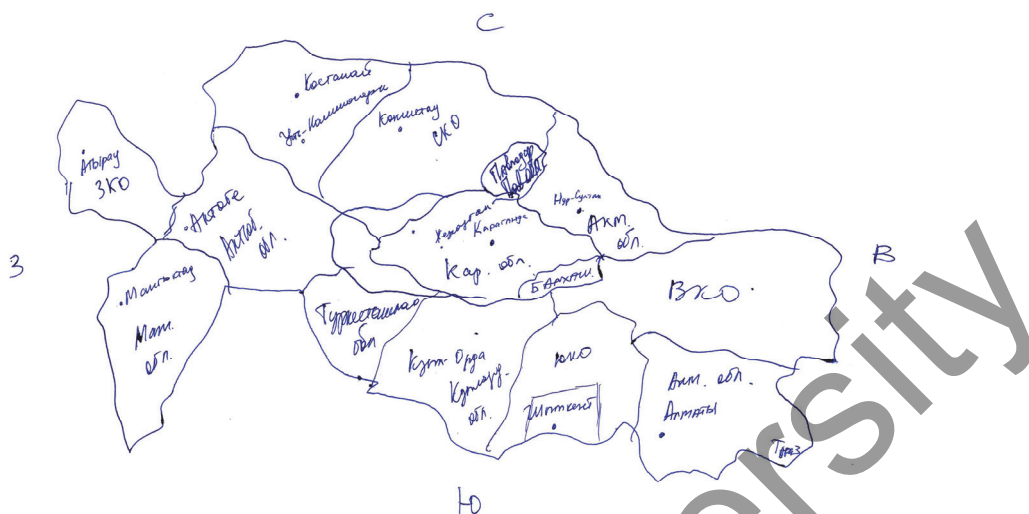
Рис. 1. Ментальная карта № 7

Второй критерий — расстояние: «собственная» область (место, где проживает информант) присутствует на всех ментальных картах, количество изображений «собственных» областей значительно превышает остальные, и чем дальше находятся области от места проживания, тем реже они обозначаются. Вместе с тем были изображены и официально не существующие области — Центрально-Казахстанская, Шымкентская и Семипалатинская: первые две области информанты, вероятно, указали из-за элементарного незнания, а Семипалатинская область действительно существовала, но была присоединена к Восточно-Казахстанской.