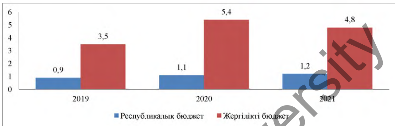
2-сурет. Қазақстан Республикасында Мемлекеттік сатып алу жоспарының серпіні, трлн. теңге

Сонымен қатар жыл сайын мемлекет тарапынан мемлекеттік сатып алу саласына үлкен қаражат бөлінеді деп айтуға болады. Төмендегі суреттен соңғы 3 жылда бөлінген қаражат көлемін байқауға болады (2-сурет).