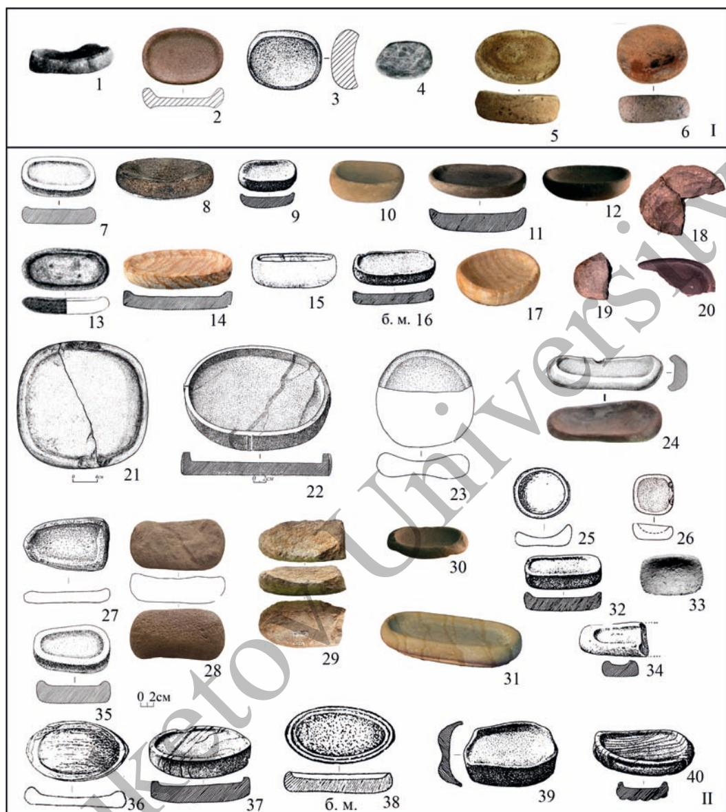
Рис. 1. Каменные жертвенники Южного Зауралья и Центрального Казахстана. I – Южное Зауралье; II – Центральный Казахстан. 1 – курган 1 у пос. Сосновский; 2 – Варненские курганы, курган 2, погребение 2 (фонды археологии и этнографии ЧелГУ, шифр хранения – 400В/2 ЧелГУ ОФ 1579); 3 – могильник Солнце-Талика, курган 4, погребение 1; 4 – курган 27 у пос. Чурилово; 5 – разрушенное погребение на местонахождении «Черная гора» (Археологическая лаборатория КГУ); 6 – могильник Кумкуль II, курган 3 (ГИМ Южного Урала, г. Челябинск, шифр хранения – ОФ-6503/5); 7 – могильник Айшрак, курган-ограда 6; 8 – могильник Койшокоы-5, курган с «усами» № 1, погребение под западной насыпью; 9 – могильник Нурманбет I, курган 2, нижнее погребение; 10 – могильник Жолкудук, курган 14; 11 – Тасмола VI, погребение «а»; 12 – могильник Жолкудук, курган 10; 13 – могильник Бозшаколь-5, курган 1, погребение 1; 14 – могильник Карамурун I, курган 9; 15 – могильник Жиланды, курган 2; 16 – могильник Карамурун I, курган 5; 17 – предположительно происходит из могильника Карамурун I; 18-20 – поселение Абылай; 21 – могильник Бақыбулак, курган 15; 22 – могильник Тасмола V, курган 2; 23 – могильник Майтан, курган 6, вводное погребение раннего железного века; 24 – могильник Караоба, курган 62 (САИ при КарУ им. Е.А. Букетова, шифр КЖЗ/1); 25 – могильник Майкубень 1, курган 5; 26 – могильник Байке-2, курган с «уса-