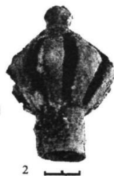
Рис. 5. Находки в погребении №1 2 - железная булава

“Бұл табылған булава - бірегей олжа, себебі мұндай темір қару-жарақ тек Батыс Қазақстан өңірінде ғана емес, жалпы Азия далаларында да сирек кездеседі. Ғалым Г.А. Фёдоров-Давыдов мұндай қаруды көшпелілерге тән емес деп есептеген. Алайда кейін ол «булавалар-шестоперлерді» қалалық жауынгерлердің қару-жарағының құрамында атап өтеді, әрі олардың дала жауынгерлерінің қаруынан онша ерекшеленбегенін көрсетеді. Осы жағдайда табылған булава қару емес, биліктің белгісі - скипетр қызметін атқарған болуы мүмкін” ( Смагулов, 2006).