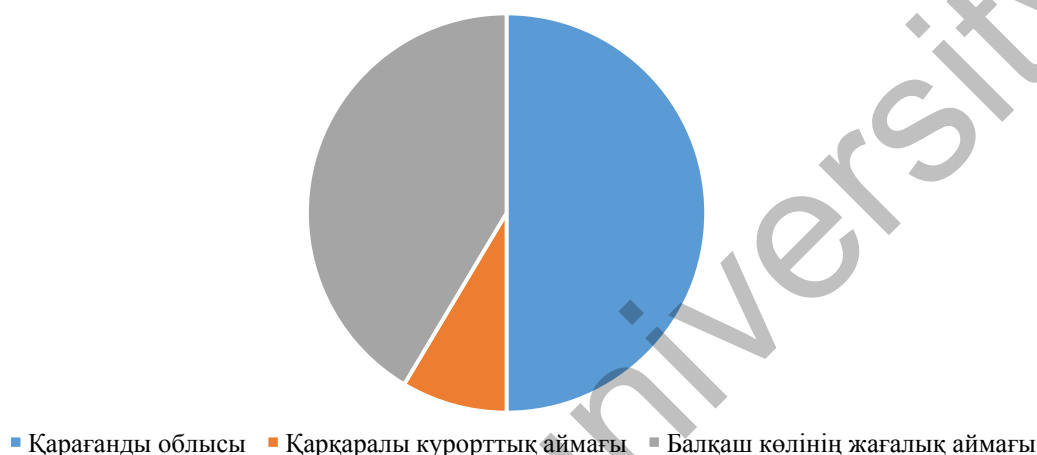
Сурет 2. Курорттық аймақтар бөлінісінде түрлері бойынша орналастыру орындары [3]

Осылайша, туризмнің ішкі және сыртқы факторларының жоғары белгісіздігі мен өзгермелілігі жағдайында Қарағандыда туризмнің «жұмсақ» инфрақұрылымын тұрақты дамытудың аса маңызды аспектісі сервистік қызметтің тиімділігін арттыру, туристік-қонақ үй кешендерінде тұтынушыларға қызмет көрсетуді ұйымдастырудың қазіргі заманғы технологияларын енгізу болып табылады. Яғни курорттық аймақтар бөлінісінде түрлері бойынша орналастыру орындарының санын көрсетуге болады (2-сурет).