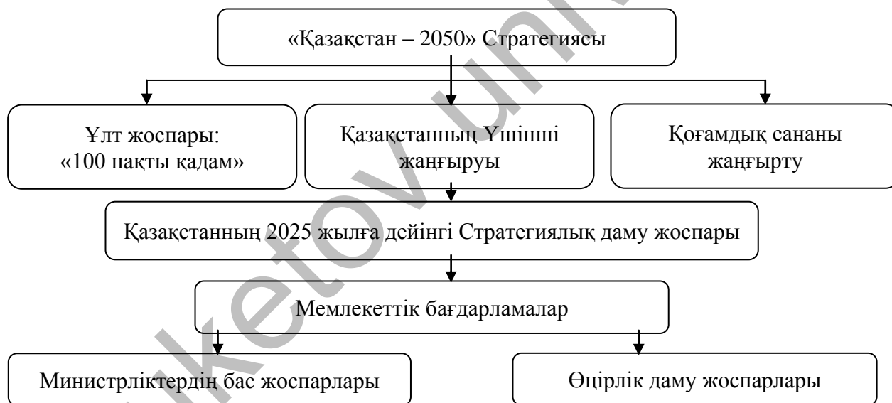
Сурет 1. Қазақстан Республикасы Ұлттық стратегияларының жалпы құрылымы

Қазақстан Республикасында ғылым, технологиялар және инновациялар саласындағы ұлттық стратегиялардың құрылымы мыналармен байланысты: Даму бағдарламасы (сурет 1).