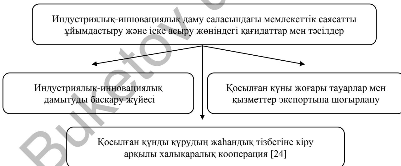
Сурет 3. Индустриялық-инновациялық даму саласындағы мемлекеттік саясатты ұйымдастыру және іске асыру жөніндегі қағидаттар мен тәсілдер

Ескертпе – жүргізілген есеп айырысулар негізінде автор жасаған