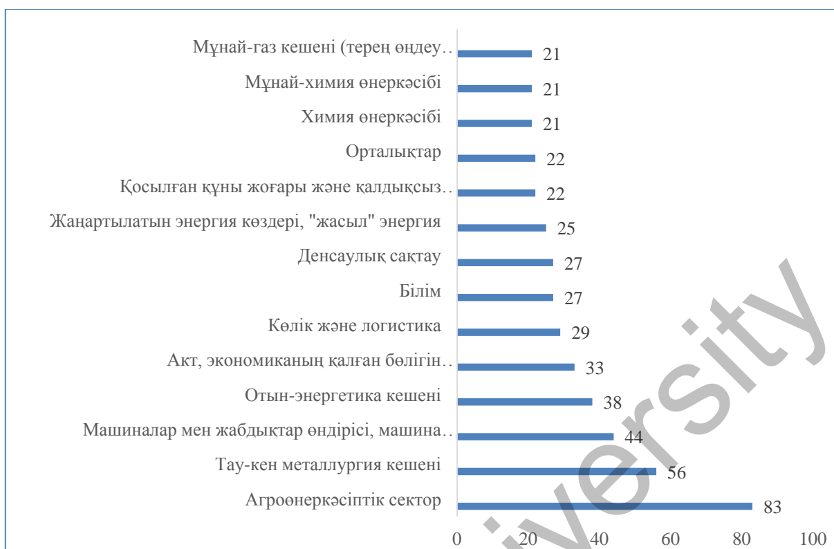
Сурет 2. Технологияларды жаңғырту және инновациялық даму үшін барынша әлеуеті бар экономикалық секторлар мен салалар

Ескертпе – жүргізілген есеп айырысулар негізінде автор жасаған