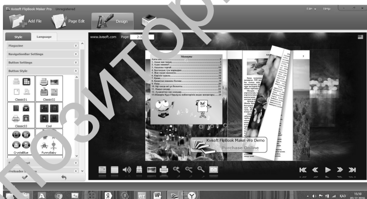
2 сурет. Kvisoft FlipBook Maker Pro-та кітап құру.

Мысалға, Main Settings бөлімінде кітаптың астыңғы бөліміндегі фонның сол жақ үстінгі бөлімінде кітаптың атын жазуға және шрифтың өзгертуге болады. Сонымен қоса фонды түстер палитрасынан таңдауға болады. Пароль орнатуға да болады. Button Style бөлімінде кітаптың астында орналасатын батырмалардың стилін өзгертуге болады. Сонымен қатар, батырмалар міндетті түрде астында емес оларды жоғарыда да орнатуға болады. Яғни, дизайн бөлімінде барлық командалар фонын, түсін, шрифтің, негізгі көрінісін өзгертуге арналған (2 сурет).