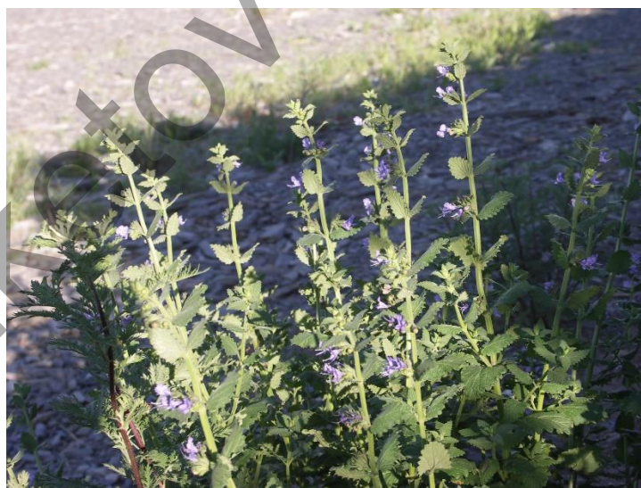
Рисунок 1. Lophanthus schrenkii в фазе цветения

Материалы и методы. Объектом исследования являлись надземные части (листья, соцветия и стебли) Lophanthus schrenkii . Сырье было собрано в фазу цветения, место сбора – горы Кент (Карагандинская область), 1 декада июня 2024 г. (рис. 1).