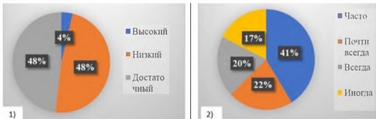
Рис. 1. Результаты опроса учителей физики школ и гимназий о качестве математической подготовки обучающихся и их умении правильно использовать математический аппарат при решении физических задач: 1) оценка уровня применения математического аппарата обучающимися при решении физических задач, 2) оценка необходимости объяснения ученикам правил математических вычислений при решении физических задач

Как видно из представленных на рисунке 1 результатов опроса только 48% учителей считают достаточным уровень применения математического аппарата обучающимися при решении физических задач. При этом 41% опрошенных учителей физики вынуждены часто объяснять ученикам правила математических вычислений при решении физических задач, 22% - почти всегда. Также, в ходе опроса было выяснено, что 51,9% учителей физики тратят в среднем на уроке 5-10 минут на объяснение правил математических вычислений, 25% - 10-15 минут, 9,6% - больше 15 минут. Одним из путей решения сложившейся проблемы должно стать применение форм комбинированного урока учителями физики и математики. Также, важной остается проблема синхронизации программ обучения по математике и физике. Решение выявленных проблем позволит снять барьеры с учеников, испытывающих трудности при выполнении математических вычислений, и, тем самым, повысить их учебно-познавательную активность.