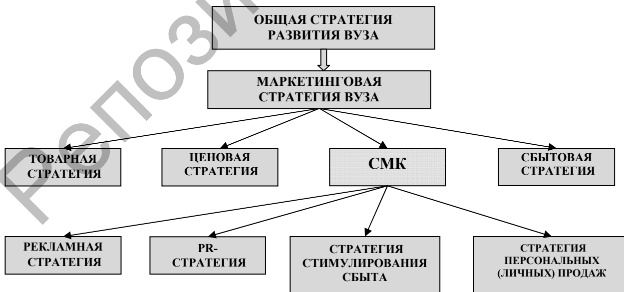
Рисунок 2. Место и элементы стратегии маркетинговых коммуникаций (СМК) в иерархии стратегий компании (составлено автором по материалам исследования)

СМК является составной частью или элементом маркетинговой стратегии вуза, которая относится к функциональным стратегиям. Сами маркетинговые коммуникации, или, как сейчас принято их называть, интегрированные маркетинговые коммуникации (ИМК), состоят, как известно, из следующих элементов: реклама, PR, стимулирование сбыта и персональные (личные) продажи. В рамках СМК по каждому из этих ее элементов также необходим стратегический подход, который находится в неразрывной связи в целом с СМК. Необходимо отметить, что необходимость применения стратегического мышления в данном случае закладывается изначально в связи с развитием и применением на практике теории ИМК. Использование маркетинговых коммуникаций в интегрированном виде, когда инструменты ИМК используются в неразрывной связи, дополняют друг друга и в связи с этим достигается синергетический эффект, и есть, на наш взгляд, основа для формирования стратегии в этом направлении, т.е. формирования СМК. Исходя из этого развернутая схема для СМК вуза выглядит следующим образом (рис. 2).