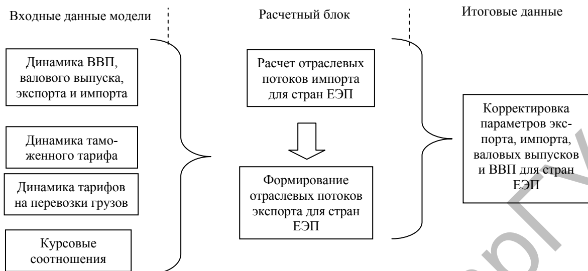
Рисунок 3. Модель внешней торговли в рамках ЕЭП (данные работы [5; 9])

Предлагаемый комплекс межотраслевых моделей экономики стран ЕЭП использовался для практических макроэкономических расчетов [6, 7]. Так, на его основе были проведены расчеты интегрального эффекта создания ЕЭП в период до 2030 г. В соответствии с результатами расчетов суммарный выигрыш трех стран от образования ЕЭП составляет свыше 2,5 % дополнительного прироста ВВП. В 2030 г. превышение ВВП над базовым сценарием составит для России 75 млрд долл. США (в ценах 2010 г.), для Казахстана — 13 млрд долл., для Беларуси — 14 млрд долл. За период 2011–2030 гг. суммарный эффект развития интеграционных связей оценивается в 632 млрд долл. США (в ценах 2010 г.) для России, 106,6 млрд долл. — для Казахстана и 170 млрд долл. — для Беларуси.