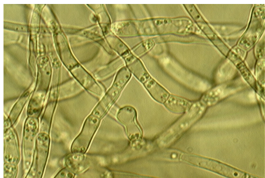
Рис. 1. Мицелий гриба A. alternata A8