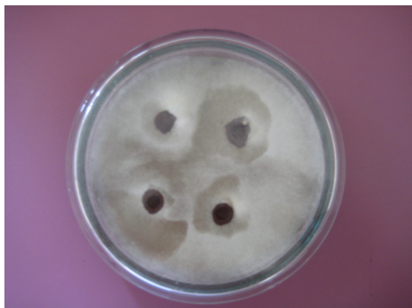
Рис. 3. Антагонистическая активность бактерий рода Bacillus subtilis um.2 по отношению к F. heterosporum 84