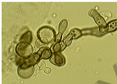
Рис. 2. Подавление гриба A. alternata A8

Показатели антагонистической активности выделенных штаммов бактерий рода Bacillus по отношению к фитопатогенным грибам приведены в таблице 1.