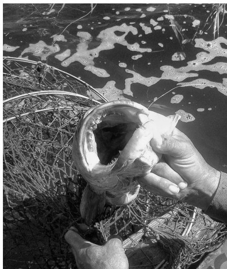
3-сурет. Жылан балықтың( Channa argus ) ауыз қуысы

Зерттеу жұмысымыздың нәтижелі болу үшін, біз 1970 жылы, яғни жылан балықтың таралу уақытындағы, және 2012 жылғы Балқаш көлінде болған басты оқиғаларды сараладық. 1970 жылдары Балқаш көлінен құрып кеткен құнды әрі дәмді балық – әйгілі Балқаш көкбасының (маринка) тағдыры қайталана ма деп қауіптенген тұрғындарды көлдің жайы аландатады. Бұл балық көлдегі тіршілік иелерін жеп тауысады, оның үстіне көлдің өзін де батпаққа айналдырып жібереді. Кезінде Балқаштың көкбасын құны төмен балық санын азайту мақсатында көлге жіберілген көксерке ығыстырып шығарған еді. Соның әсерінен бұл көлді мекен еткен жыртқыш балықтарға қорек жетпеді. Ал Қызыл кітапқа енгізілген Балқаш алабұғасын көксерке жеп тауысты [5].