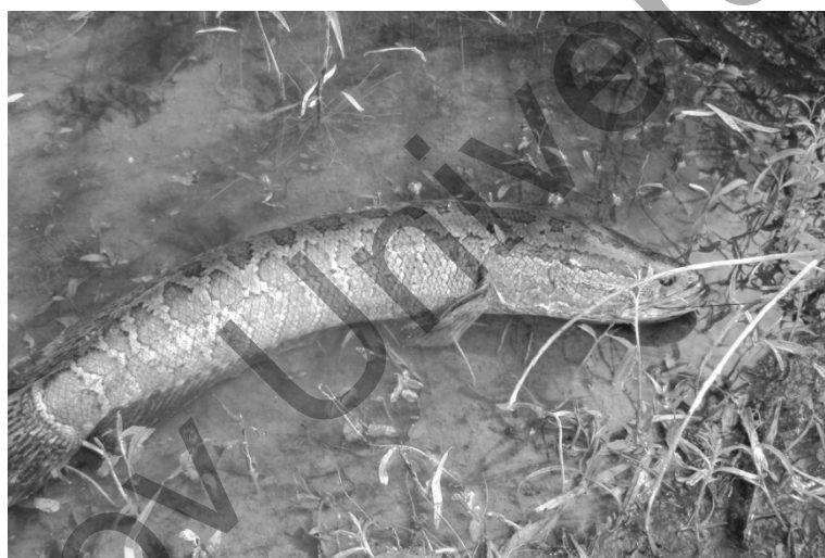
1-сурет. Жыланбалықтың ( Channa argus ) көл жағасында жатқан көрінісі

Ең алдымен, арнайы зерттеу жұмысы үшін, Балқаш көлінің қамысты бөлігінен балық ұстайтын торға жыланбалық ұстап алынды. Ұсталған жыланбалықтың ( channa argus ) өлшемдерін алып, зерттеу жұмысы жүргізілді. Терісі жасыл-қоңыр қара дақтарымен жабылған, жыланбалықтың денесі бас, тұлға және құйрық бөлімдерінен тұрады. Жыланбалықтың денесі 20 сантиметрге дейін балық болып келеді ал қалған бөлігі жыланға ұқсай өседі. Бас бөлімінде жұп танау тесігі, екі көзі бар. Тұлға бөлімінде жұп көкірек, жұп құрсақ және дара арқа жүзбеқанаттары орналасқан. Құйрық бөлімінде сыңар құйрық және аналь жүзбеқанаттары бар. Жыланбалықтың жүзу кезіндегі қимылдары оның қанаттарының түрліше қозғалуына байланысты, ілгері қарай қозғалуына құйрық асты қанаты басты орган болып табылады. 2 арқа жүзу қанаты, жалғыз құйрық асты (аналь) қанаты, иегінің астында дара мұртшасы бар. Арқасындағы бірінші жүзу қанаты мен құйрық асты (аналь) қанаты өте ұзын және осы қанаттарда тікенекті талшықтар болмайды. Арқа қанаттары активті қозғалыстарға қатыспағанымен жыланбалық денесінің орнықты болуына олардың үлкен әсері тиеді. Балқаш көлінде көбейген жыланбалық айдынға, ашық, терең суларға шықпайтынын байқадық, оның бірден бір себебі: қорек. Яғни, жыланбалыққа батпақты, қоғалы, лайлы сулардан қорегін тауып жеу оңайға түседі, ал айдында мұндай мүмкіндік бола бермейді (1-сурет).