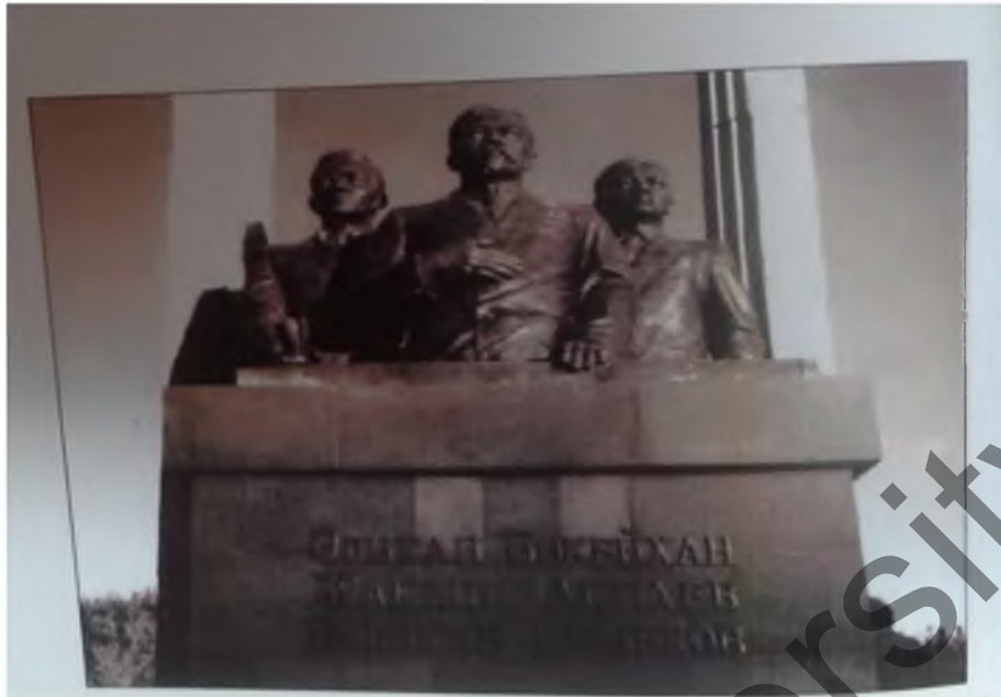
Ақтоғайдағы үш арысқа арнап қойылған ескерткіш. [2,50-б. ]

Ескерткішті жасаған Қарағандылық мүсінші белгілі суреткер Жаубасар Қалиев. Бүгінде Қарағанды, Қарқаралы қалаларының орталық екі көшесіне, Ағадір станциясының № 131 орта мектебіне мен Ақтоғай ауданы, Қаратал ауылындағы орта мектепке Ә. Ермековтің есімі беріліп отыр. Қарағанды қаласында М. Құл-Мұхаммедтің ұсынысы мен Ермеков көшесінде « Әлімхан Ермеков» атты үлкен кітап дүкені ашылды. 2000 жылдан бастап, Қазақстан Республикасының мәдениет, ақпарат және қоғамдық келісім министрілігінің сұранысы бойынша Президенттік мәдени орталығындағы мұражайда Ә.Ермековке байланысты құжаттар мен фотосуреттер жинақталуда.