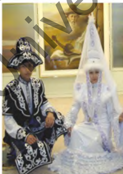
б) Свадебные костюмы