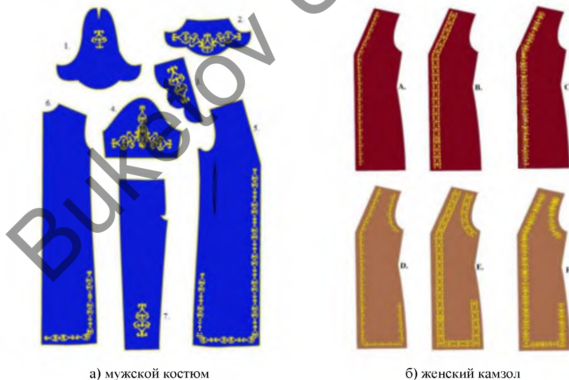
а) мужской костюм

Среди вопросов был и такой «Какую версию полочки камзола, изображенную на рисунке (рисунок 3), вы бы выбрали?». Наибольшее предпочтение выпало на варианты А и С, а наименьшее на В и Е.