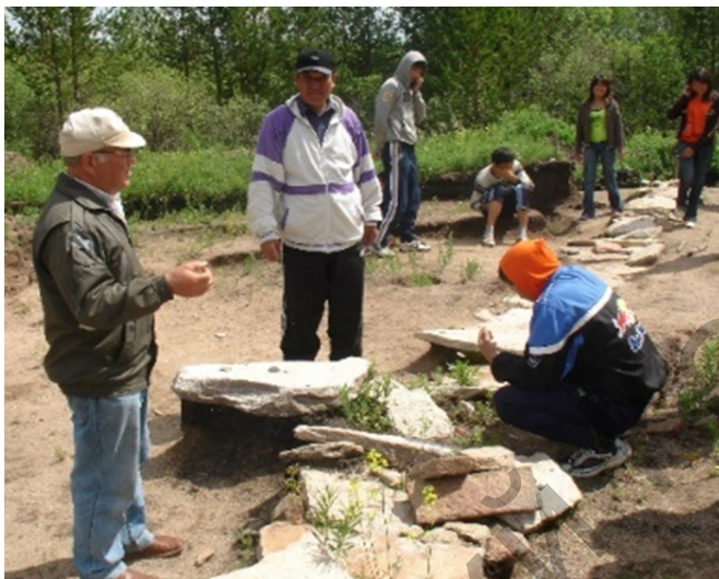
Сур. 3. Алат қонысында. 2015 ж.

Сол жылдары ол тарих ғылымдары бойынша Қазақстан Республикасы білім және ғылым министрлігі жанындағы аттестаттау комитетінің (ФСҚҰАК) эксперттік комиссияның мүшесі болды.