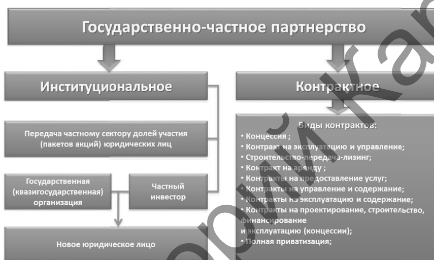
Рисунок 1. Направления и формы реализации ГЧП в Казахстане

В качестве основного документа нормативно-правового обеспечения деятельности СПК можно отметить «Концепцию по созданию региональных социально-предпринимательских корпораций», которая была разработана в соответствии со «Стратегией территориального развития Республики Казахстан до 2015 года» и была принята соответствующим Постановлением Правительства Республики Казахстан от 31 мая 2006 г. № 483 [9–11]. Как было отмечено в данных нормативно-правовых документах, основная цель созданных СПК — «содействие экономическому развитию регионов путем консолидации государственного и частного секторов, создание единого экономического рынка на основе кластерного подхода».