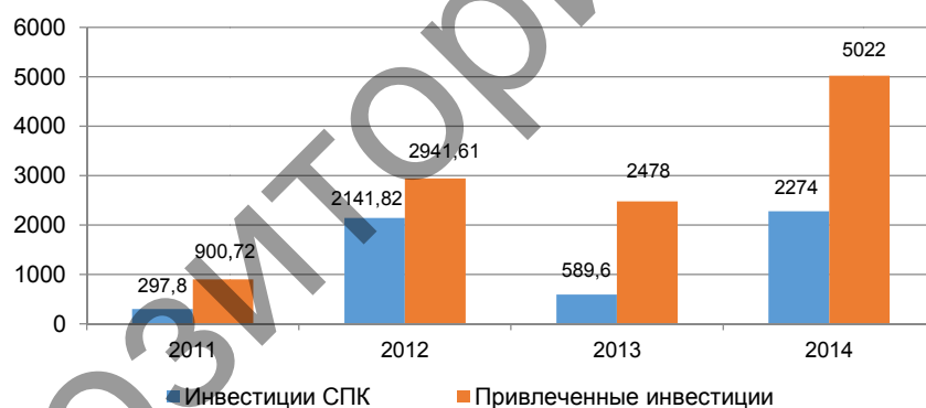
Рисунок 4. Динамика показателя соотношения привлеченных средств инвесторов к вложенным средствам СПК (источник: [14, 15])

При оценке инвестиционной деятельности, подобной СПК, компании государственно-частного партнерства необходимо оценить уровень инвестиционной привлекательности проектов, который может характеризовать такой показатель, как соотношение привлеченных средств сторонних инвесторов к общему объему вложенных средств СПК (рис. 4).