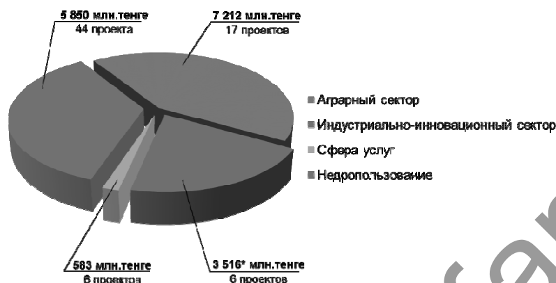
Рисунок 3. Структура инвестиционного портфеля АО «НК «СПК «Сарыарка» на 01.01.2015 г. (источник: [14, 15])

Без ТОО «ИПММ» в структуру инвестиционного портфеля компании (рис. 3) включено всего 73 проекта на сумму 17,2 млрд тенге, в том числе основная масса проектов (44) по количеству — в сфере недропользования, по объемам инвестиции — в сфере АПК. Проекты индустриально-инновационной сферы количеством 6 и объемом инвестиции 3 516 млн тенге составляют 20,3% от общего объема инвестиционного портфеля.