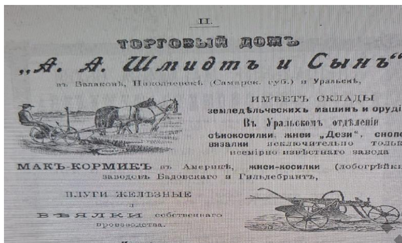
Рисунок 2. Торговый дом А.А. Шмидт и сын. Уральск, 1902

На рисунке 2 представлена рекламная афиша, на которой изображены сельскохозяйственные машины и орудия, предлагаемые к продаже в г. Уральске через склады «Торговым домом А.А. Шмидт и сын». В их состав входили: сенокосилки, жнеи «Дези», сноповязалки, всемирно известных заводов Мак Кормик в Америке жнеи, косилки (лобогрейки) заводов Бадовскаго и Гильдебранта, плуги железные и веялки собственного производства. Эти орудия труда использовались в казахских хозяйствах [14; 230].