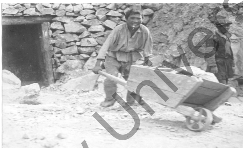
Рисунок 5. Майкаинский рудник. — Павлодар, 1907.

Начиная с первой половины XIX века казахи пограничного пространства стали заниматься отхожими промыслами.