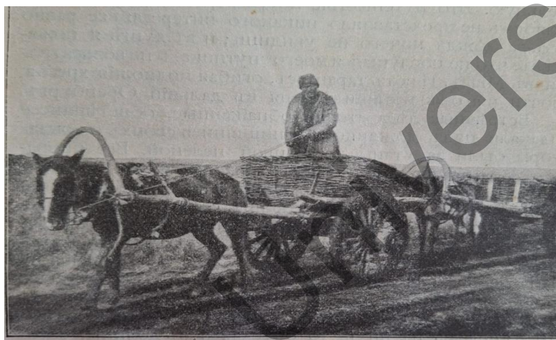
Рисунок 3. Казах на арбе. — М., 1909