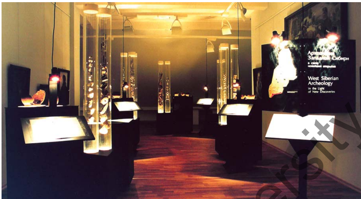
Выставка «Археология Западной Сибири в свете новейших открытий». Ханты-Мансийск, 2002 г.

К статье О. Н. Корочкиной и Э. Р. Усмановой