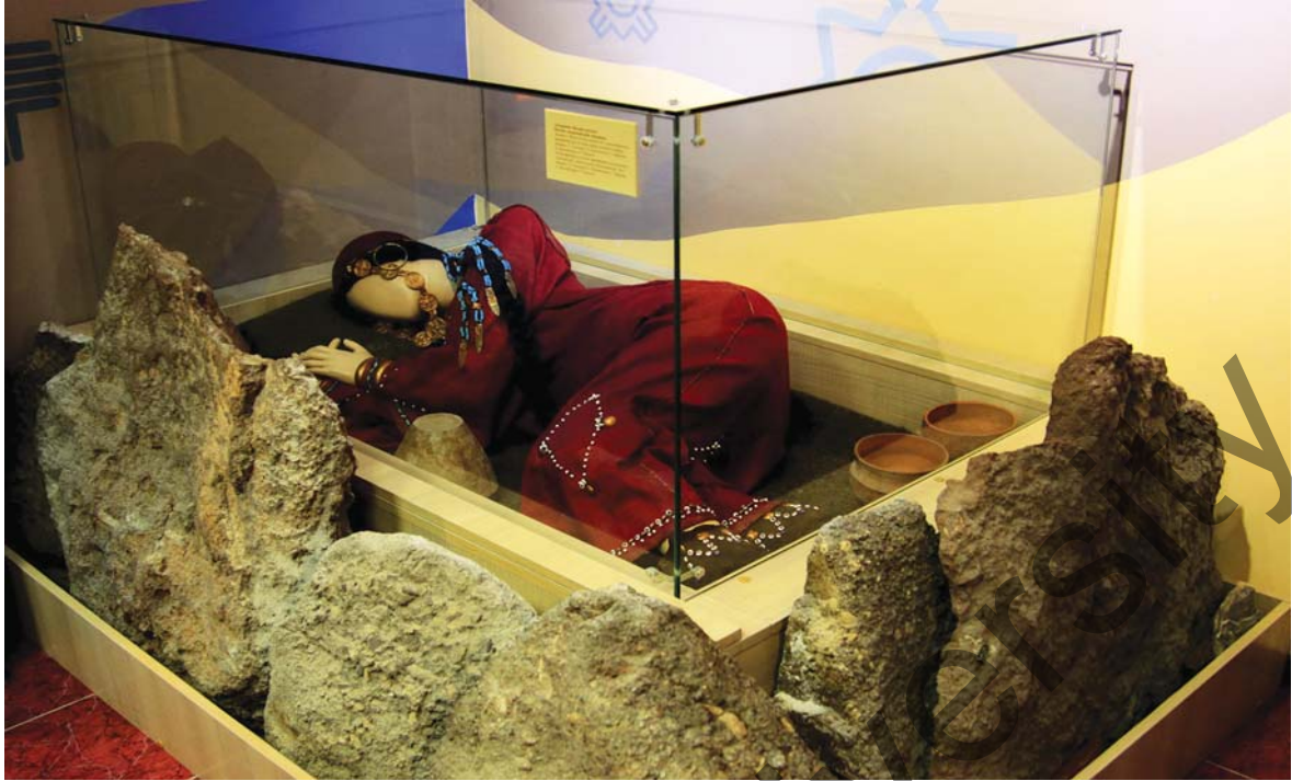
Фрагмент экспозиции: «Сакральная комната. Погребение женщины эпохи бронзы». Лисаковский музей истории и культуры Верхнего Притоболя. 2015 г.