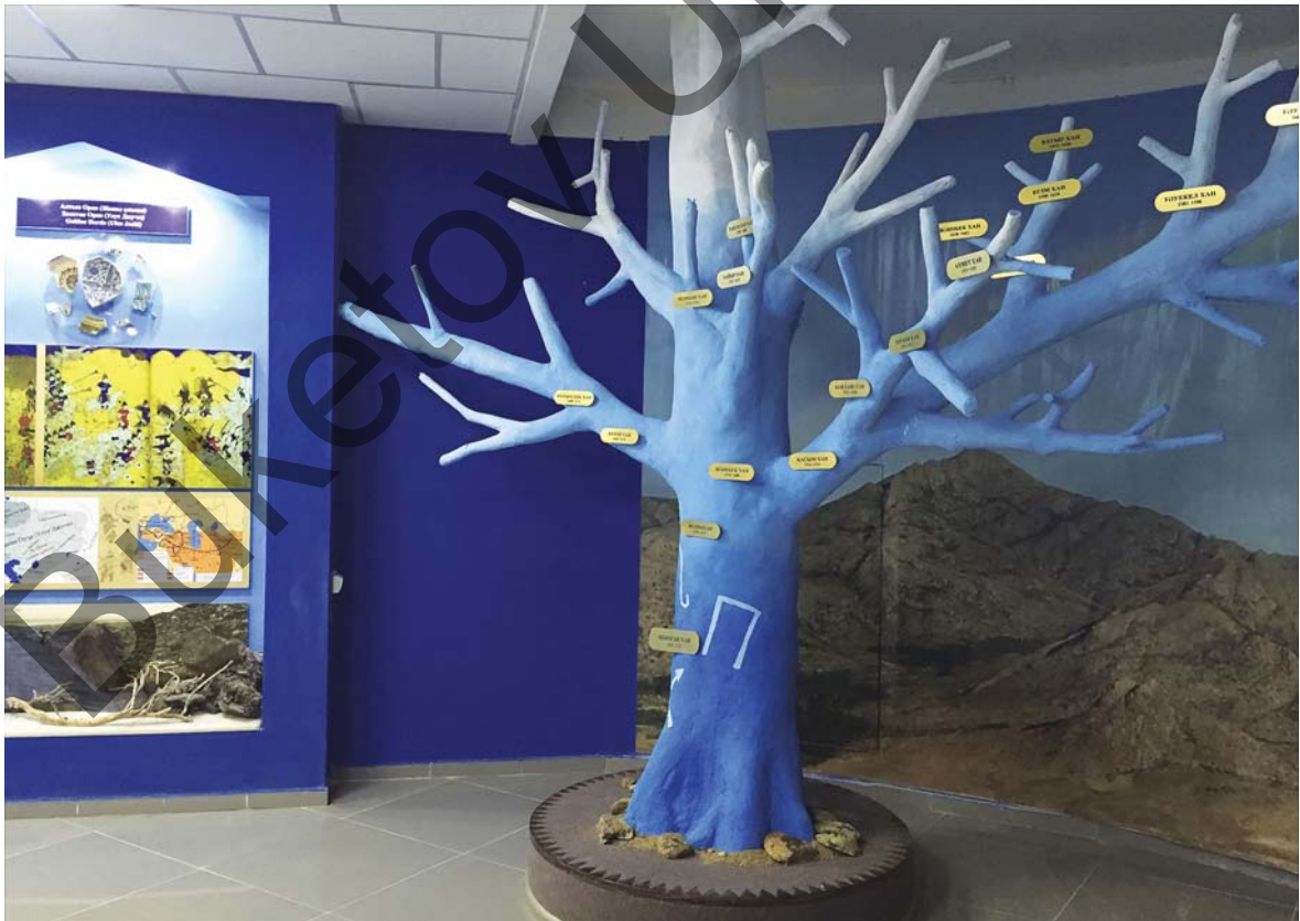
Фрагмент экспозиции: инсталляция «Ханское древо» Национальный историко-культурный и природный заповедник-музей «Улытау». 2015 г.