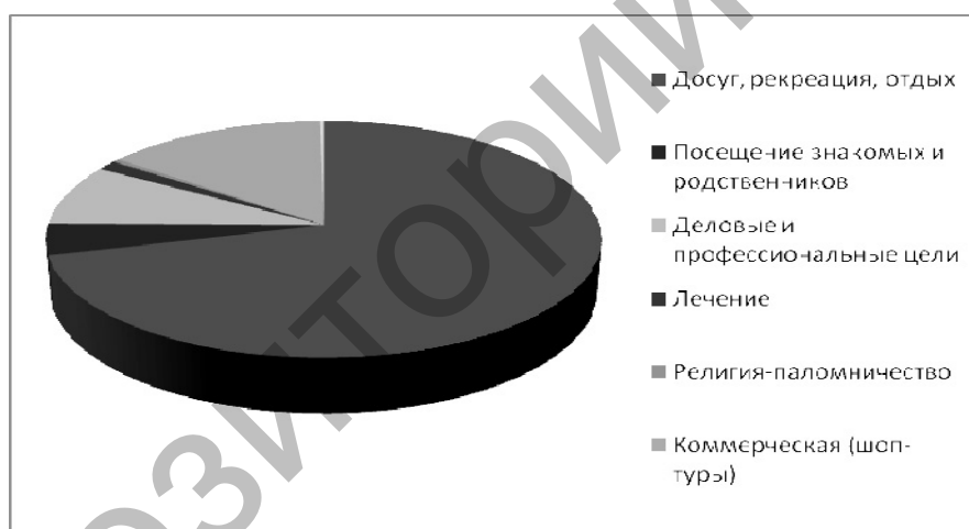
Рис. 2. Выезд резидентов РК по целям поездок в 2009 г. (составлено автором по данным Агентства РК по статистике за 2009 г.)

Узнаваемость Казахстана на рынке Азии составляет 80 %, а на рынке Европы — 45 %. Среднее количество дней пребывания туристов в республике в 2009 г. составляло 1–3 дня. Как показывают данные рисунка 1, наибольший удельный вес по обслуженным международным посетителям-нерезидентам занимают поездки с деловыми и профессиональными целями (61 %) и досуг, рекреация, отдых — 17 %. Число резидентов, выезжавших за границу по туристским путевкам с 2007 г. по 2009 г., уменьшилось на 32 %. Согласно статистическим данным, поток казахстанских туристов в страны СНГ составил 6,3 %, в страны вне СНГ — 93,6 %. Основная масса туристов-резидентов выезжала в страны СНГ — Кыргызстан и Россию. Среди стран вне СНГ наибольшей популярностью пользуются Китай, Турция, Объединенные Арабские Эмираты, Германия, Нидерланды, Таиланд. В 2009 г. туристы из Казахстана посетили около 86 стран мира. Среднее количество дней пребывания казахстанских туристов в странах СНГ составляет 6 дней, в странах вне СНГ — 7. При этом основными целями выезда являлись досуг и отдых — 74 %, а деловые и профессиональные цели составили лишь 7 % (рис. 2). При этом сезонность выездного туризма (наибольший поток туристов) приходится