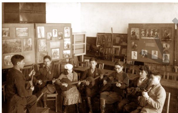
Фото 3. Петропавловское казахское педагогическое училище. Участники художественной самодеятельности.