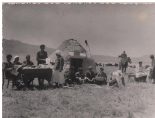
Фото 1. КППМ 17067/2. «Красный уголок» в ауле. 20-е годы XX в.

хорового пения привлекалась учащая молодежь, в том числе и слушатели Институтов просвещения (Инпросов), находящихся в крупных городах — Алма-Ате, Семипалатинске, Оренбурге.