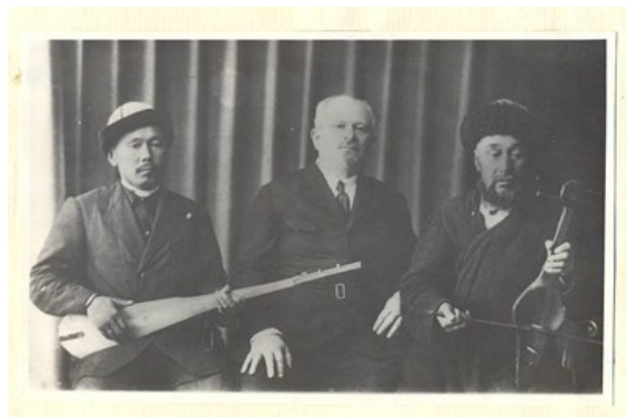
Фото 5. КП 2734 № 5. Фотокопия. Матовая фотобумага, ч/б изображение. Разм. 17,5 x 22,6 см; паспорту 24,5 x 18,5 см. Фотография А.В. Затаевича среди народных казахских певцов.

личество казахских народных песен, многие из которых вошли в его знаменитый сборник «1000 песен казахского народа» (1925) и др. Творчество же и труд композитора показали, насколько он ценил и восхищался необыкновенной образностью и красочностью казахской традиционной музыки.