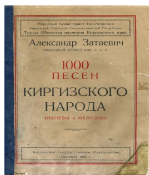
Фото 7. КП 2732(Д). Книга песен. 1925 г. Оренбург. Картон, бумага, типографская многоцветная печать. Разм. 17,5x26 см. Книга А. Затаевича «1000 песен киргизского народа. Напевы и мелодии». Киргизское государственное издательство. Из фондов ЦГМ РК