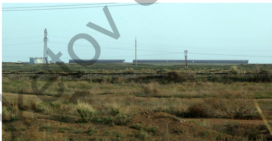
3-сурет. Қазіргі кездегі полигон (бұрынғы полигоннан қалған бөлігі)

Приозерск қаласына ұшақтар қонатын, бірақ, аэропорттың аты шифрланғандықтан, халық арасында әуе айлағы «Камбала» деп аталған. Қалаға 6 км жетпей бүгінгі күнге дейін белсенді жұмыс атқаратын полигон орны көрінеді (3-сурет). Бұл полигонды Ресей жартылай жалға алып отыр, жартылай қазақстандық қызметкерлер жұмыс жасайды.