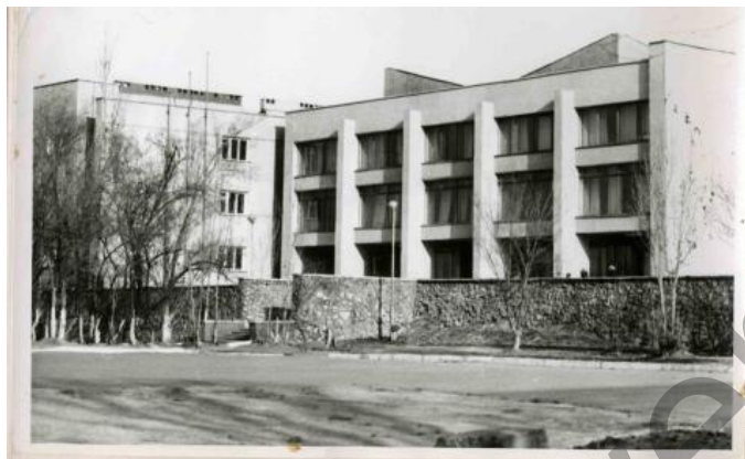
8-сурет. Пионерлер үйі

Келесі маңызды ғимарат — Пионерлер үйі. 1981 жылы тұрғызылған типтік ғимарат. Жалпы көлемі — 6908, 4 шаршы метрді құрайды. Балаларға арналған шығармашылық үйірмелер мен білім орталықтары, концерт залы бар үлкен ғимарат. 2014 жылы ғимаратқа реконструкция жасалды. Ғимараттың функционалдық қызметі ауысқан жоқ. Қазіргі кезде Приозерск қаласының «Достық» Балалар және жасөспірімдер шығармашылық орталығы» ҚМКМ (8-сурет).