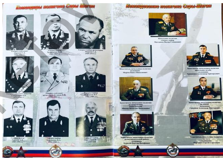
2-сурет. Сарышаған полигоны мен Приозерск қаласы құрылысының жетекшілері (сурет Сарышаған полигоны тарихы мұражайының дерекқорынан)