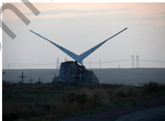
5-сурет. Қала кіреберісіндегі шағала құсының ескерткіші

Бұл ескерткіштер қала үшін символдық мағынаға ие. Мұрағаттық дерекөздер бойынша осы Бетпақдаланы арқарлар мекендеген және шағала құстары Балқаш көлінің сәні болған. Сондықтан екі жануарды қаланың нышаны ретінде көрсеткен.