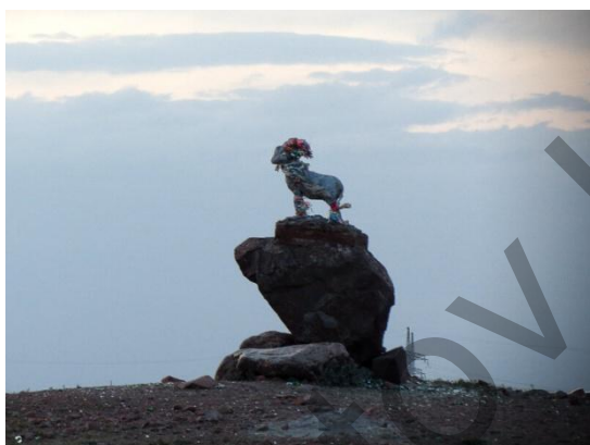
4-сурет. Қала кіреберісіндегі арқар ескерткіші

Қаланы қайтадан қалпына келтіру мақсатында 1993 жылы қала әкімшілігіне қазақ азаматы отырғызылды. Қазақстанның Тұңғыш Президенті Н. Назарбаевтың шет елдерде жүрген қандастарымызды отанына қайтару жобасы аясында Приозерск қаласына Өзбекстанның Бұхара, Науаи облыстарындағы қазақтарды арнайы КАМАЗ көлігін жіберіп көшіріп әкелген. Ең алғашқы қандастар 1995 жылы осы мекенге келіп қоныстанған. Мемлекет тарапынан қандастарға барлық жағдай жасалды, алайда, қираған қала одан әрі қирай түсті. Жұмыссыздықтың салдарынан бос қалған үйлерді бұзып, құрылыс материалы ретінде, полигоннан қалған металдар қазылып, күн көріс көзі ретінде сатылды. Алғаш салынған көптеген үйлер мен ғылыми зерттеу институттары толық қиратылды. Орындары бос қалды. 2005 жылға дейін қала шартты түрде жабық болды. Қалаға кіреберістегі бақылау бекінісі 2009 жылға дейін жұмыс атқарды. Қала толық ашылғаннан кейін қала кіреберісіне арқардың (4-сурет) және шағала құсының ескерткіштері қойылды (5-сурет).