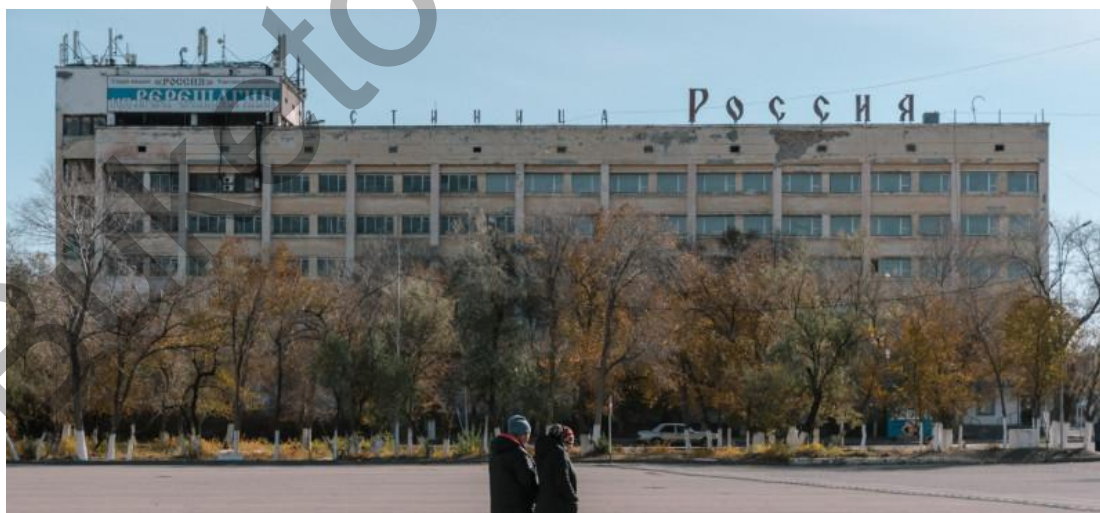
7-сурет. «Россия» қонақ үйі

Приозерск қаласының кеңістігін ревитализациялау және реновациялау үрдісі жоғарғы деңгейде дамуда деп айту қиын. Қаланы жаңарту жұмыстары аз мөлшерде жүргізілуде. Қираған ғимараттардың орнына көп қабатты жаңа тұрғын үйлер салынды. Алайда ескі үйлер толық жаңартылған жоқ. Әкімшіліктің пікірі бойынша, оған үлкен қаржы керек, сондықтан, жаңа тұрғын үйлер тұрғызған жеңіл деп саналады. Бір жағынан бұл тарихи-мәдени мұраны сақтап қалу үрдісі деп те түсінуге болатын шығар. Шын мәнінде, қаланың тарихи келбетін сақтап қалу қиын. Өйткені, қазіргі кезде ескі қаланы көрген тұрғын жоқ деп айтуымызға болады. Барлығы көшіп келгендер. Қаланың басым бөлігін шет елдерден келген қандастар құрайды. Олар қала тарихын білмейді. Қала тарихы туралы мәліметтер де көп сақталмаған, құпиялы болғандықтан барлығы жойылған. Дегенмен, бүгінгі күнге дейін сақталған ғимараттарда аз емес. Қаланың тарихи-мәдени мұраларына келесі ғимараттар жатады: «Россия» қонақ үйі (7-сурет), Пионерлер үйі (8-сурет), Офицерлер үйі (9, 9.1-суреттер).