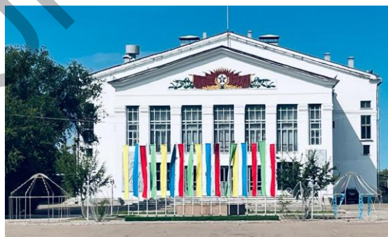
9.1-сурет. Горнизонды офицерлер үйі (мұрағаттық үйі, қазіргі кездегі фото)

Горнизонды офицерлер үйі қаланың бас алаңында орналасқан. Бұл полигон орталығы Приозерск қала тұрғызылғанда салынған ғимарат. Мемлекеттік, халықаралық жиындар мен маңызды шешімдер қарастыратын орын ретінде салынған. Қазіргі күні де ғимарат өзінің функционалды қызметін жоғалтқан жоқ. Әскери ашық және жабық іс-шаралар ұйымдастырылады. Ресейлік және қазақстандық әскер басшылары тең қызмет атқарады. Бұл ғимарат полигон туралы құпия маңызды ақпаратты сақтайтын мекеме болып табылады. Аталған ғимаратта «Сарышаған полигонының тарихы музейі» орналасқан. Бұл музейге арнайы рұқсат қағазбен ғана кіруге болады.