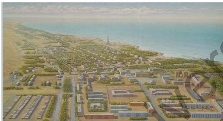
1-сурет. Приозерск қаласының алғашқы бейнесі (Сурет 1972 жылы беймәлім суретшімен салынған. Суретті жергілікті тұрғын Б.М. Геворгизов сақтап қалған, қазіргі кезде музейде сақталған)

Приозерск қаласының алғашқы бейнесін төменде көрсетілген суреттен көруге болады (1-сурет).