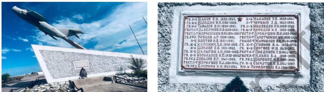
6-сурет. Ұшқыштарға арналған монумент

Алтыншы суретте көрсетілген ескерткіш Балқаш көлінің маңында орналасқан. 1968 жылы құлаған ұшақ пен оның экипажына арналған монумент. Монументтің астындағы постаментке ұшақта болған ұшқыштардың аттары жазылған. Ашық аспан астындағы әскери техника музейі қала мұнарасы алдындағы саябақта орналасқан. Ол жерден әртүрлі ракеталарды, ұшақтарды, ауыр техникаларды көруге болады. Жыл сайынғы сынақтан өткен ракеталар мен ұшақ түрлері қойылған (6-сурет).