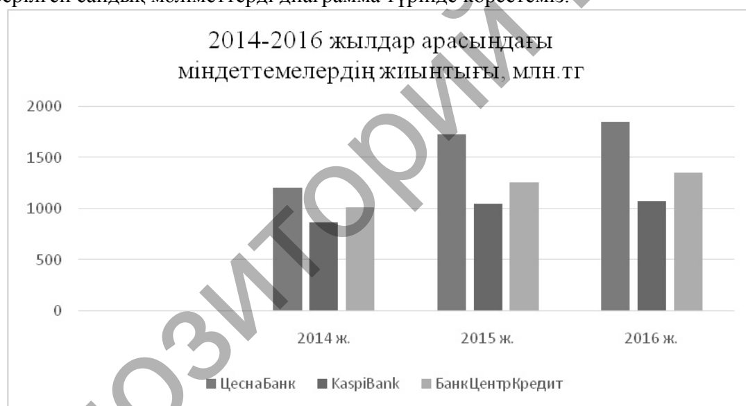
1 сурет 2014-2016 жылдар арасындағы міндеттемелердің жиынтығы

Берілген сандық мәліметтерді диаграмма түрінде көрсетеміз.