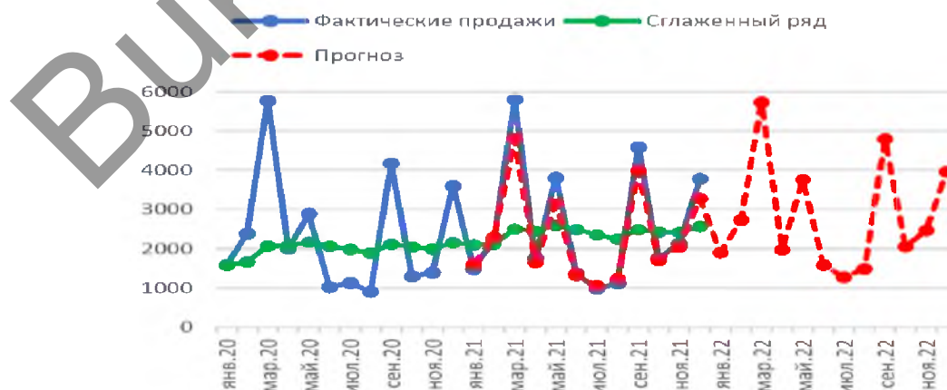
Рисунок 1. Фактические и прогнозные продажи для товара с артикулом 3142

Представим полученные результаты в виде графика на рисунке 1.