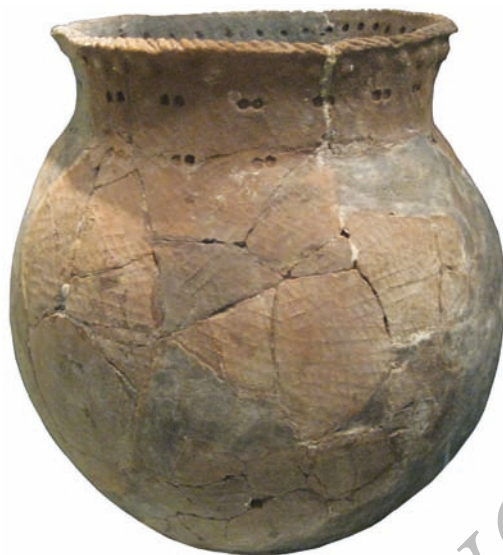
Рис. 1. Типичный керамический сосуд улахан-сегеленняхской культуры из культурного горизонта VII стоянки Улахан Сегеленнях