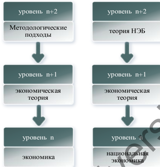
Рисунок 4. Сравнение экономической теории и теории НЭБ с учетом уровней организации знаний

Раскрывая мета-теоретический подход в проектировании теории НЭБ важно отметить, что обеспечение безопасности уровня n требует как минимум рассмотрения явления на уровне n+1 . Уровневое представление является необходимым для проведения разграничения между экономической теорией и теорией НЭБ. Представим это на рисунке 4.