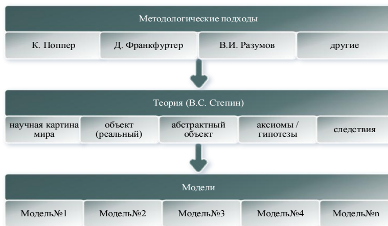
Рисунок 1. Оригинальная когнитивная технология связи методологических подходов, теории и моделей

Экономическая наука традиционно использует моноаспектный подход к построению теории. Предлагаемая автором технология, представленная на рисунке 1, выражает переход от моноаспектного к полиаспектному научному исследованию, когда один и тот же объект описывается с разных точек зрения, оформленных соответствующими моделями. Еще одним достоинством предложенной когнитивной технологии является то, что она позволяет организовать познание не только как последовательность переходов от одного компонента к другому, но и на ее основе любое исследование можно организовать в форме сочетания нескольких параллельных процессов. На рисунке 1 — это одновременная проработка подходов, теории, моделей.