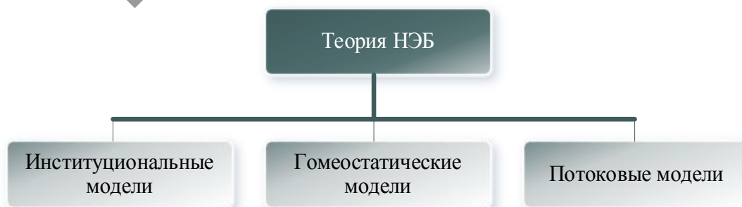
Рисунок 2. Многоаспектный подход к проектированию теории НЭБ

В этой связи представим особенность проектирования теории НЭБ на рисунке 2.