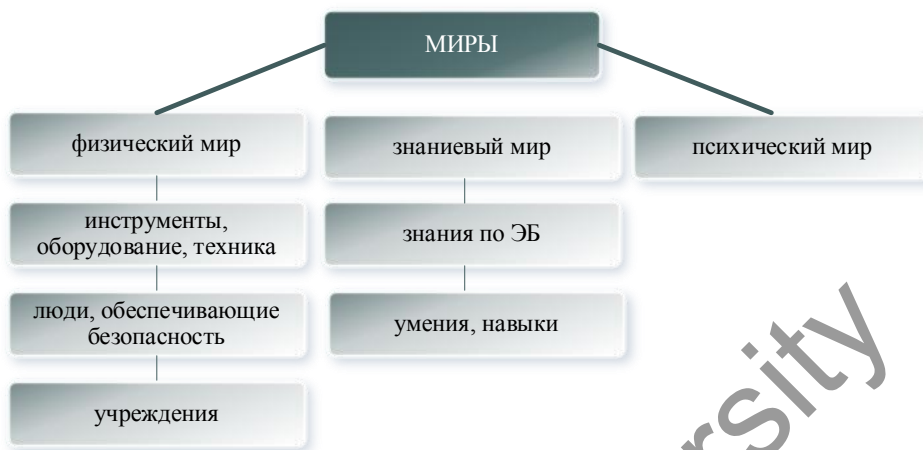
Рисунок 6. Представление объекта НЭБ в интерпретации концепции трех миров К. Поппера

Интерпретируем концепцию трех миров К. Поппера для анализа текущего положения ЭБ и НЭБ и представим на рисунке 6.