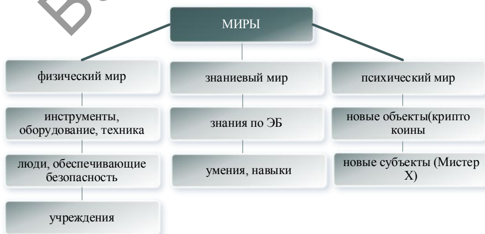
Рисунок 7. ЭБ и НЭБ в трех мирах К. Поппера

Интерпретация концепции трех миров К. Поппера дает возможность обнаруживать ранее не наблюдаемые объекты и субъекты. Полная интерпретация концепции трех миров К. Поппера в применении к ЭБ и НЭБ представим на рисунке 7.