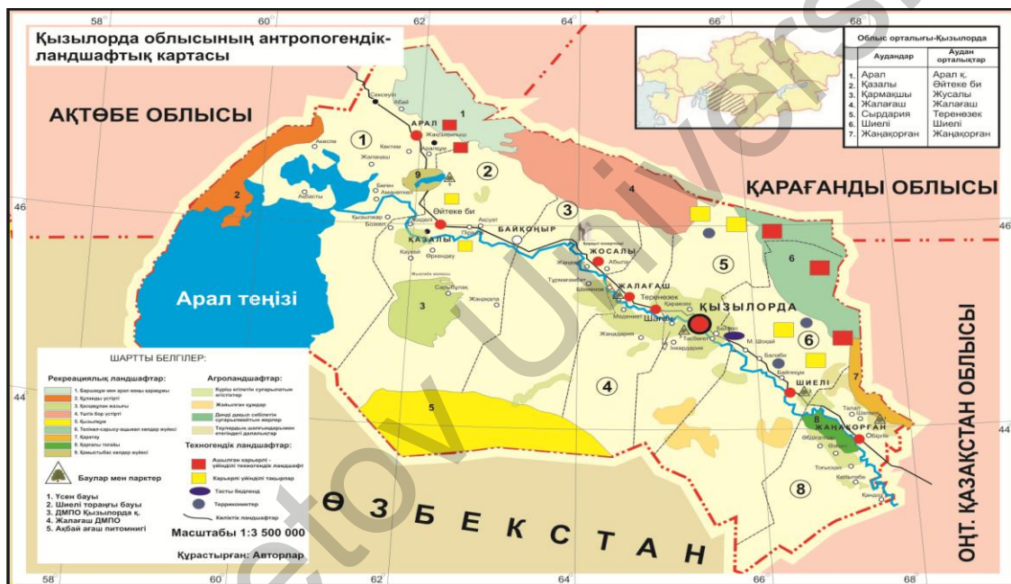
3-сурет. Қызылорда облысының антропогендік-ландшафтық картасы

Осы топтастырудың негізінде Қызылорда облысының топографиялық, пайдалы қазбалар картасы, экономикалық, ауыл шаруашылығына жарамды жерлер, көлік жүйесі және қорықтар мен ұлттық саябақтар картасы пайдаланып, Қызылорда облысының антропогендік-ландшафтық картасы құрастырылды (3-сурет).