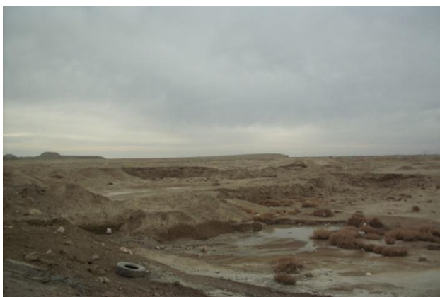
4-сурет. Ашылған карьер

Облыс бойынша барлық егіс көлемі 241,2 мың гектарды алатын болса, оның ішінде бидай, дәнді жүгері, күріш егістігінің көлемі кеміп, керісінше картоп, көкөніс, бақша дақылдарының егіс көлемі көбейген. Жалпы алқаптың 35-40 %-ын күріш егісі алады, ал күріш ауыспалы егісіндегі айнымас элементі ретінде көп жылдық шөптер алқабы 25-27 %-ды құрайды.