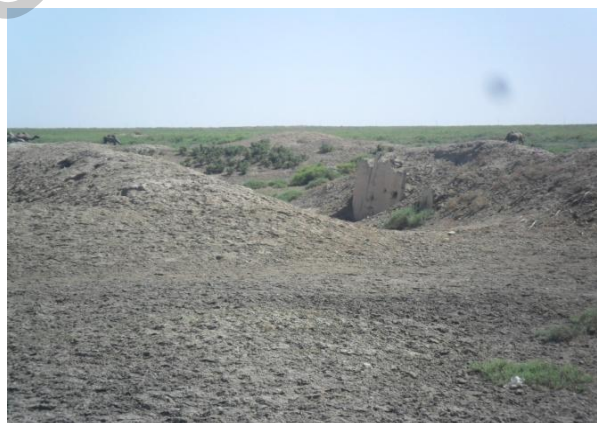
7-сурет. Егістік алқаптардың табиғи қалыпқа түсу көрінісі

Негізгі егістік аймақтарда пайдаланатын жердің топырағының 60-70 % эрозия, дефляция сияқты жағымсыз процестерге ұшырайды. Осының салдарынан топырақтың органикалық және химиялық құрамы өзгереді: азот пен фосфордың мөлшері төмендейді, арам шөптер қаптайды т.б.