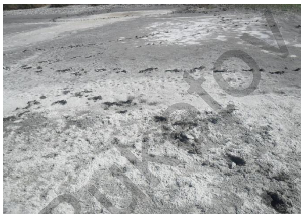
6-сурет. Күріштік егіске пайдаланғаннан кейінгі көрінісі

Табиғи ландшафтармен салыстырғанда агроландшафтардың құрылымы динамикалық тұрақсыз және тез өзгермелі. Осыдан 50-60 жыл бұрын Қазақстанның солтүстік аймағында тың және тыңайған жерлерді игеру дала зонасына тән комплекстердің жасанды егістікпен алмасуы осының айғағы.