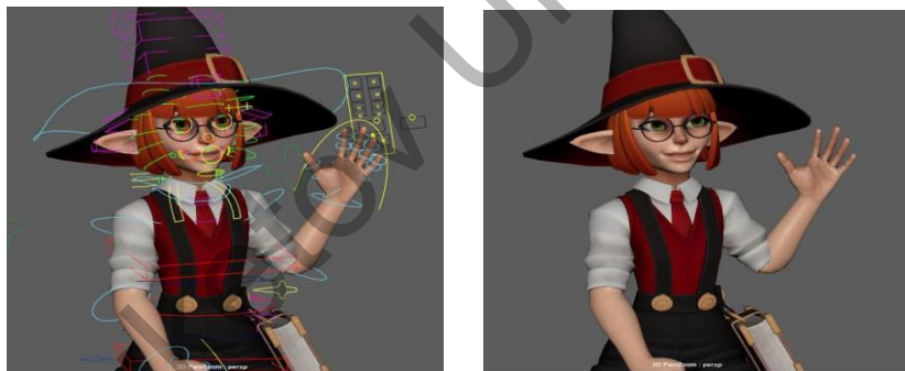
Рисунок 2 Модель персонажа после риггинга

При создании скелета кости соединяются последовательно, принцип которых определяется прямой или обратной кинематикой. Простая и малоресурсная коммуникация — это прямая кинематика (Forward Kinematics — FK), но она не может управлять системой соединений, которую может предложить Inverse Kinematics (IK).