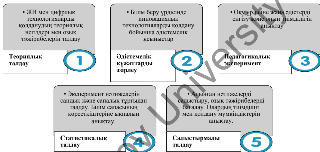
1-сурет. Зерттеу жұмысының негізгі әдістемелік кезеңдері

Зерттеу барысында теориялық-әдістемелік талдау, шетелдік және отандық зерттеулерді сараптау, педагогикалық эксперимент, сауалнама, салыстырмалы және статистикалық талдау әдістері қолданылды. Зерттеу жұмысы бірнеше әдістемелік кезеңдерден құралды (1-сурет).