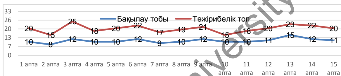
4-сурет. Экспериментке қатысқан топтардың білім деңгейінің салыстырмалы нәтижелері

Қалыптастыру кезеңінде «Шығыс Қазақстан облысының географиясы» курсының оқыту барысында әрбір апта тақырыптарына сәйкес қорытынды бақылау алынды. Яғни 15 аптаға 15 бақылау жұмысы ұйымдастырылды. Алынған теориялық білімдерін бекіту және екі бақылау тобының білім деңгейінің өзгеруін бақылау мақсатында өткізілген мониторинг нәтижесі 4-суретте ұсынылды.