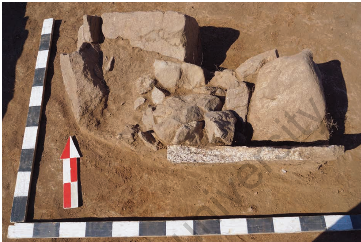
Рис. 3. Комплекс Жанажұрт. Скопление камней и плита в центральной части сооружения № 1 3-сур. Жаңажұрт кешені. № 1 құрылыстың орталық бөлігінде тастар мен плиталардың жиналуы Fig. 3. Zhanazhurt complex. Stone accumulation and a slab in the central part of structure no. 1

сти. После снятия слоя дёрна, расчистки камней и стенок объекта было установлено, что ограда относится к разновидности многоплитных. Её размеры с учётом развала стенок составили 4.2×3.8 м. Сооружение было ориентировано стенками по сторонам света. Северная стенка ограды достигала в длину 3 м и состояла из трёх плит, слегка наклонившихся наружу. С внешней стороны она была укреплена средними и мелкими по размеру камнями. Размеры плит стенки составили 0.85–1.3×0.35–0.37×0.09–0.1 м. Западная стенка ограды была длиной 3.25 м и состояла из двух плит, слегка наклоненных наружу. Размеры плит составили 1.6–1.65×0.4–0.45×0.09–0.1 м. Восточная стенка длиной 3.2 м состояла из двух завалившихся наружу плит размерами 0.7–2.5×0.4–0.45×0.08–0.1 м и была укреплена снаружи в нескольких местах крупными плитками. Южная стенка имела длину 2.7 м. Она состояла из двух сильно наклонившихся наружу плит, одна из которых была продольно обломлена. Размеры плит составили 0.5–2.2×0.35–0.6×0.09–0.1 м. Внутреннее пространство ограды было заполнено камнями в несколько слоёв до уровня материка. В ходе исследования объекта находок не обнаружено. Реконструируемые первоначальные размеры сооружения составляют около 3.2×3.0 м. По окончании раскопок была осуществлена рекультивация объекта.