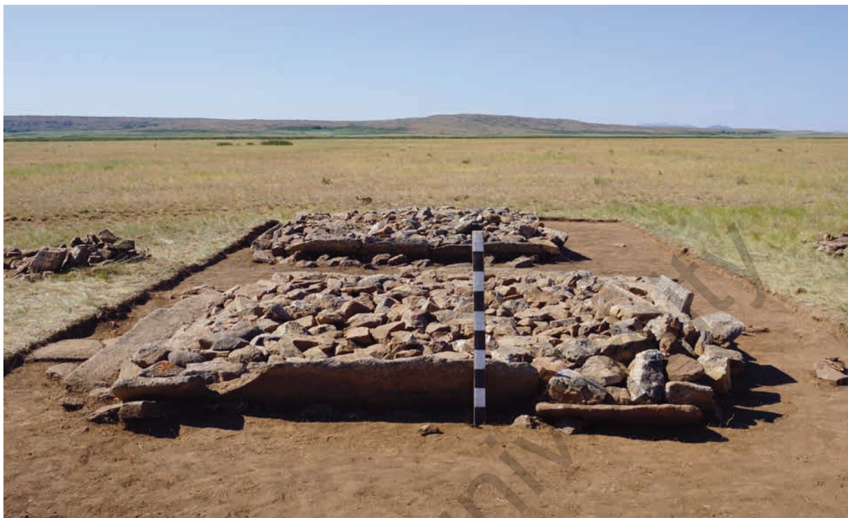
Рис. 2. Комплекс Жанажурт. Фото оград (с севера) 2-сур. Жаңажұрт кешені. Қоршаулардың фотосуреті (солтүстіктен) Fig. 2. Zhanazhurt complex. Photo of fences (from the north)