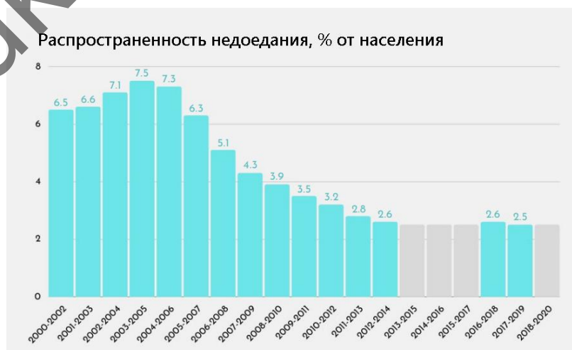
Рисунок 3 – Распространенность недоедания в Казахстане.

Казахстан значительно сократил распространенность недоедания за последние два десятилетия. На рисунке 3 показано, что в 2000 году около 5 процентов населения Казахстана страдало от недоедания, но с тех пор распространенность неуклонно снижалась. Серые столбцы указывают на PoU ниже 2.5 %.