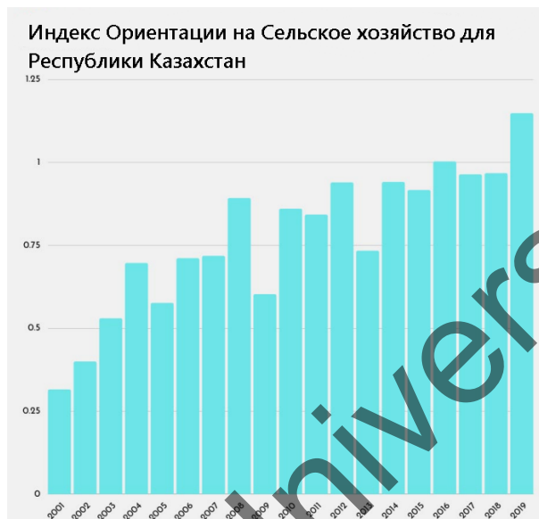
Рисунок 2 – Индекс Ориентации на Сельское хозяйство. Источник [2]

Тенденция в Казахстане показывает, что сельскому хозяйству постоянно уделялось внимание со стороны политиков, о чем свидетельствует постоянный рост значений за последние два десятилетия.