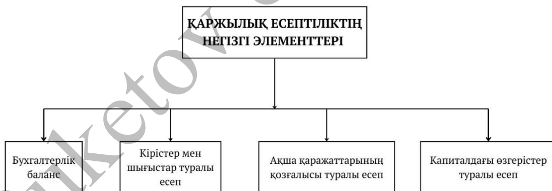
Сурет 1. Негізгі элементтер

Зерттеушілердің пікірінше қаржылық есептілік – компанияның қаржылық жағдайы, шаруашылық қызметі және ақша ағындары туралы мәліметтер беретін маңызды құжат. Оның негізгі элементтері мен құрылымы халықаралық қаржылық есептілік стандарттарына (ХҚЕС) негізделген және ұйымның қаржылық ахуалын толық сипаттауға мүмкіндік береді. Қаржылық есептіліктің басты элементтері ретінде негізгі бірнеше элементтер маңызды орын алады. Айталық бұл элементтер: