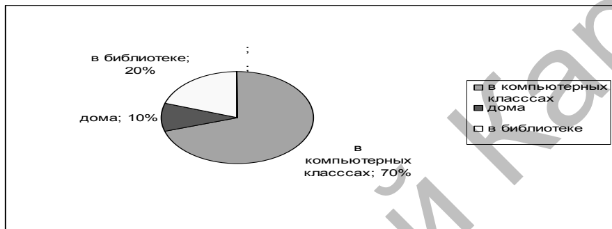
Рисунок 1. Место проведения самостоятельной работы

машнего чтения по английскому языку, 14 % учащихся воздержались от ответа. Больше половины опрошенных детей этой же школы пожелали, чтобы в школе больше проводилось внеклассных мероприятий и было бы интересно самостоятельно готовиться к ним. Нужно отметить, что в рамках предмета «английский язык» все учащиеся ШОД имени Н.Нурмакова часто разрабатывают групповые проекты, защищают их на уроке. Мнения же учащихся гимназии № 3 по данному вопросу разделились: 59 % учащихся ответили положительно, 18 % — воздержались от ответа, 22 % учащихся ответили, что не разрабатывают групповые проекты. Также выяснилось, что в обеих школах на уроках английского языка продуктивно используются компьютерные технологии, в том числе интерактивные доски, электронные учебники, интернет и т.д. Большинство учащихся (77 %) гимназии № 3 ответили, что задания для самостоятельной работы им даются в виде перевода текстов, разработки тестов, реферирования, составления диалогов. А в ШОД имени Н.Нурмакова возможности для самостоятельной работы создаются не только в классных кабинетах, что было выявлено при анкетировании. Места проведения самостоятельной работы можно увидеть на рисунке 1.