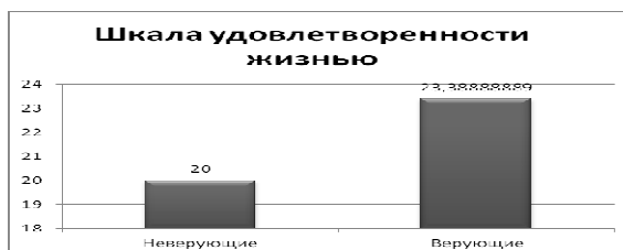
Рисунок 1 – Сравнительные данные верующих и неверующих по шкале удовлетворенностью жизнью

Описание результатов исследования целесообразно начать со сравнительного анализа данных по шкале удовлетворенности жизнью между верующей молодежью и молодыми людьми атеистической направленности (Рисунок 1.):