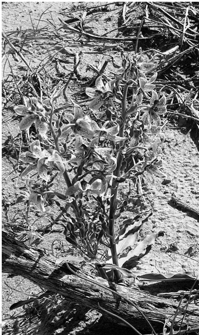
Рисунок 1. Рябчик Карелина – Fritillaria karelinii (Fisch. ex D. Don) Baker (син. Rhinopetalum karelinii Fisch. ex D. Don)

в марте–апреле. Растет по глинистым и песчаным пустынным степям, сухим предгорьям и пескам на территории всего Казахстана, за исключением северного, встречаясь в 17 флористических районах [4].