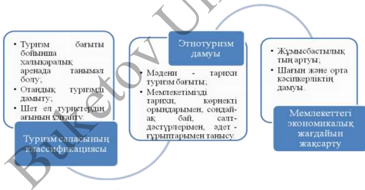
1-сурет. ҚР этнотуризм саласының даму сипаттамасы

Сонымен қатар, этнотуризмді дамыту арқылы, біз мемлекетіміздің түкпірлерінде орналасқан, тарихы мол, әдет-ғұрыптарға, дәстүрлерге бай мекендермен ғана таныстыра қоймай, сонымен сол аймақтарда тұратын жастарды жұмыспен қамтуға мүмкіндік бере аламыз.