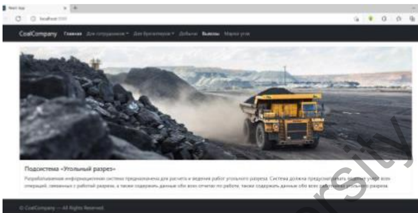
Рисунок 3 - Окно приложения

У пользователя есть возможность, для каждой таблицы через приложение есть возможность удалять данные и почти в каждой есть возможность редактирования данных, кроме тех где первичный ключ задается не автоматически, а сам пользователь задает, там изменения данных невозможно, кнопки изменения и удаления можно увидеть на рисунке 4.