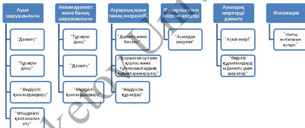
3-сурет. Германиядағы Ауылшаруашылық банкінің бағдарламалары

Бүгінгі таңда Ауыл шаруашылық жалдау банкі бар, оның мақсаты Германияның ауыл шаруашылығы мен ауылдық аумақтарын дамыту болып табылады, ал федерация мен жерлердің тиісті өкілеттіктері ескеріледі (Steil, C., et al., 2016). Банк стандартты даму кредиттерін беруге, сондай-ақ банк бағдарламаларында көрсетілген агробизнес пен ауылдық өңірлер үшін аса тиімді шарттарда бөлінетін арнайы кредиттерге назар аударады (3-сурет).