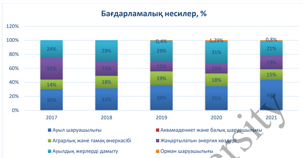
4-сурет. Бағдарламалық несиелер, млн евро

Ескерту — автор мәліметтер негізінде құрастырған (ГФР Ауыл шаруашылық рента банкі)