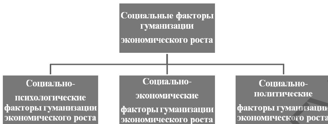
Рисунок 1. Разновидности социальных факторов гуманизации экономического роста

Производственно-организационные факторы гуманизации экономического роста — это факторы, направленные на создание комфортных условий для труда работника, что, в свою очередь, позволяет повысить производительность труда и, в конечном счете, увеличить объемы национального производства. В процессе труда на человека воздействует множество факторов, оказывающих влияние на его работоспособность и здоровье. В зависимости от условий, при которых осуществляется труд, выделяют шесть групп: